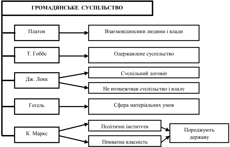
Рис. 1. Окремі філософсько-політичні думки щодо громадянського суспільства

суспільство, у якому приватній власності належить вирішальна роль, породжує державу [1].