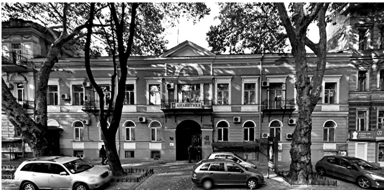
Ил. 1. Здание на Пушкинской улице в Одессе. 2014

каменный флигель, систерна, галерея в земле под каменным сводом». Кроме этого, на участке оставались заготовленные строительные материалы и «до ста чугунных квадратных в один аршин плит» [6, л. 2–2 об.]. Все это было приобретено в казну за 20 тыс. руб. серебром, часть денег выручили от продажи бывшего конторского дома.