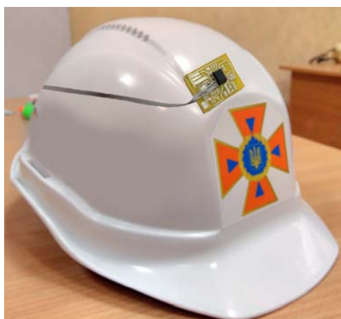
Рис. 5. Расположение акселерометра на шлеме спасателя