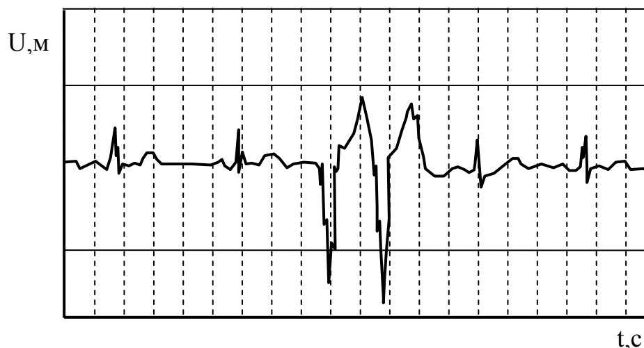
Рис. 3. Порушення серцевого ритму у вигляді дублету

Параметри (показник) варіабельності серцевого ритму є високоінформативними при визначенні функціонального стану організму людини. На рис. 2 [3] показано фрагмент вимірювання кардіопотенціалу при порушенні серцевого ритму.