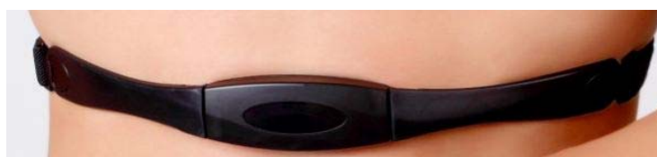
Рис. 2. Индивидуальный пояс мониторинга состояния

Датчики состояния и беспроводной прибор передачи данных АСКФС могут быть рассредоточены и размещены в костюме спасателя (рис. 1) или сгруппированы и размещены в индивидуальном поясе (рис. 2).