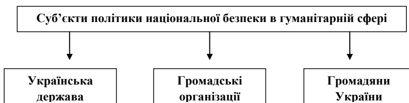
Рис. 2. Суб'єкти політики національної безпеки в гуманітарній сфері

Головним суб'єктом політики національної безпеки у гуманітарній галузі є Українська держава як політичний інститут, що виявляє, захищає та задовольняє загальнонаціональні інтереси в гуманітарній сфері. Суб'єктами національної безпеки у гуманітарній сфері є також громадяни України, об'єднання громадян. Важливо, щоб їхня діяльність враховувала не лише їхні групові чи особистісні інтереси, а й інтереси держави і суспільства в цілому, але в той же час й держава повинна враховувати не тільки власні загальнонаціональні інтереси, а й інтереси громадянського суспільства і громадян України (рис. 2).