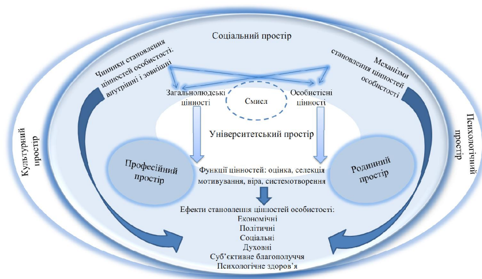
Рис. 2. Модель становлення цінностей особистості