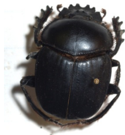
Рис. 2. Жук вида Scarabaeus sacer (Священный скарабей)