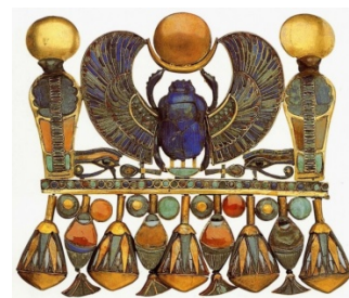
Рис. 9. Пектораль. Около 1350 г. до н.э. Золото, лазурит, бирюза, сердолик, стекло. Каирский музей