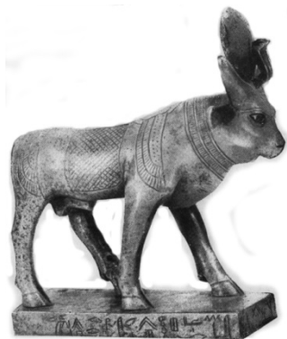
Рис. 4. Апис. Бронза. VII в. до н.э. Санкт-Петербург. Эрмитаж

Неужели ювелиры Древнего Египта не умели придавать минералам и другим материалам (стеклу, керамике) шарообразную форму? Умели. Об этом довольно красноречиво говорят бусы с хорошо обработанными сферическими бусинами (рис. 6).