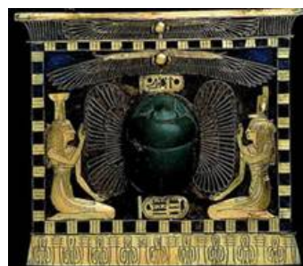
Рис. 15. Пектораль. Древний Египет. Золото, лазурит

Вместе с тем, это не означает, что жуку-навознику не осталось места в символической картине мира Древнего Египта. Его уникальные способности вполне вписываются в другой образ. Ведь он — труженик. Собирает навоз, делает из него шарик, катит его в норку. Там, в норке, шарик переделывает в “грушу”, в узкую часть которой самка откладывает яйца. Яйца эти созревают там, как в инкубаторе, ровно двадцать восемь дней. Двадцать восемь дней — лунный цикл. Не солнечный, а лунный. На двадцать девятый день навозник вытаскивает из норки эту “грушу” и бросает её в воду. Там, в воде, и появляются молодые жучки-навозники. Разве всё это не достойно того, чтобы положить в основу символа? Символа жизни, символа творения, символа упорства в достижении поставленной цели, символа того, как из инертной, бесформенной массы чужих отходов можно слепить нечто новое, ценное, дающее жизнь. Разве всё это не является атрибутами и функциями демиурга?