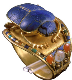
Рис. 7. Браслет со скарабеем. Золото, лазурит, сердолик, бирюза. Древний Египет. Гробница Тутанхамона. XIV в. до н.э. Каирский музей