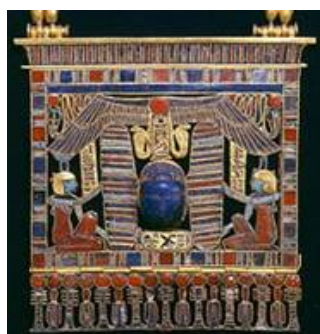
Рис. 14. Пектораль Сенусерта III. Лазурит, сердолик, бирюза, золото

Так или иначе, но подобные примеры позволяют предположить, что под Скарабеем, как символом Солнца, древние египтяне подразумевали не навозника, а какого-то другого жука. Или жуков (если допустить, что в древности не придавали значения видовым отличиям насекомых, понимая под словом “скарабей” любого жука).