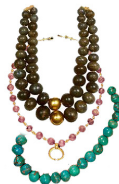
Рис. 6. Древнеегипетские бусы

Следовательно, в украшениях сферическая форма Солнцу не придавалась сознательно, поскольку воспринималось оно как диск.