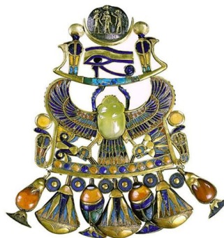
Рис. 13. Подвеска со скарабеем, поддерживающим ладью Луны. Из гробницы Тутанхамона. Золото, халцедон, сердолик, лазурит, цветная смальта. Каирский музей

Жук в этой подвеске не держит в передних лапах Солнце, а, напротив, поддерживает ладью Луны (“левый глаз” означает Луну). Однако здесь есть деталь, однозначно указывающая на “солнечность” жука: крылья и хвост сокола. Да и сам жук, вырезанный из полупрозрачного жёлтого халцедона, кажется солнечным.