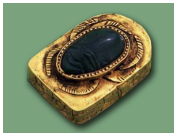
Рис. 8. Скарабей фараона Себекмсафа. Золото, нефрит. Около 1600 г. до н.э. Британский музей