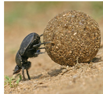
Рис. 3. Жук-скарабей катит навозный шарик

Вместе с тем, среди многочисленных изображений Священного скарабея нет ни одного, где жук толкал бы Солнце задними ногами.