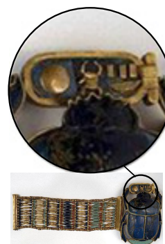
Рис. 11. Браслет с фиксацией тронного имени Тутанхамона. Верхний Египет. Фивы. Долина Царей. Золото, синее стекло, лазурит, кальцит

Следовательно, Солнце, изображённое над Скарабеем, означает не то, что он его держит, а то, что это — текст, и читать его надо сверху вниз. Другими словами, здесь Скарабей — не символ, а знак.