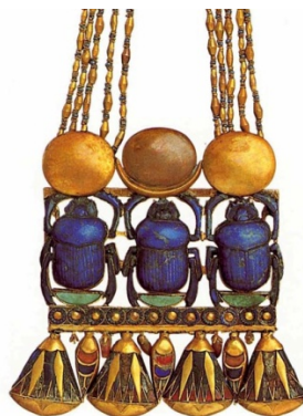
Рис. 5. Подвеска с тремя скарабеями. Золото, лазурит, сердолик, цветная смальта. Каирский музей