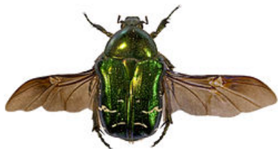
Рис. 12. Жук вида Cetonia aurata (бронзовка золотистая)

Такой жук кажется более убедительным в образе символа Солнца в таком украшении, например, как подвеска из гробницы Тутанхамона (рис. 13).