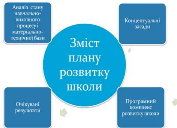
Рис. 3. Зміст плану розвитку школи

Результат роботи – поява стратегічного шкільного документа, який має IV розділи (рис. 3).