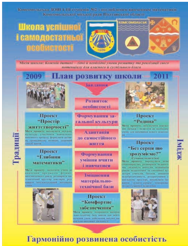
Рис. 2. Макет постера "План розвитку школи Комсомольської ЗОШ № 2, 2009 – 2011. Школа успішної і самодостатньої особистості"

творчою групою був представлений у вигляді постера (рис. 2).