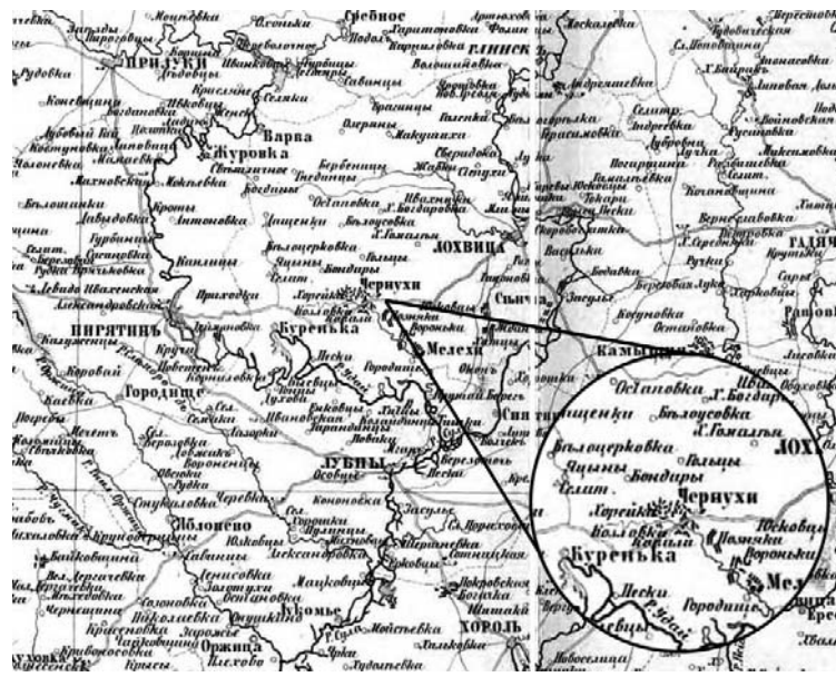
Рис. 1. Фрагмент карти Полтавської губернії, виданої типографією Л.Ільїна