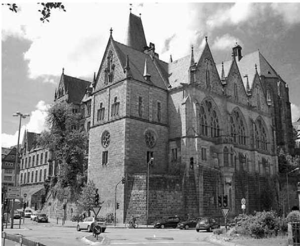
Марбурзький університет імені ландграфа Пиліпа (Німеччина)

За радянських часів молодший Макаренко майже не згадувався офіційними біографами та дослідниками спадщини Антона Семеновича, оскільки під час громадянської війни він був офіцером Білої армії, а у 1920 році взагалі емігрував із України. Історія пошуків Віталія Макаренка надзвичайно цікава і пов'язана з ім'ям відомого чеського науковця-макаренкознавця Лібора Пехи 2 , який першим із зарубіжних дослідників (із країн, які не входили до соцтабору) мав можливість працювати в радянських архівах і особисто спілкуватися із вихованцями А. С. Макаренка. Саме під час однієї з таких зустрічей вчений дізнався таємницю, про яку вперто мовчало офіційне радянське макаренкознавство – про існування у педагога брата-білогвардійця, який емігрував за кордон. Довгий час Л. Пеха мріяв розшукати цього брата, але після невдачі "Празької весни" зрозумів неможливість здійснення свого бажання. Тоді він від-