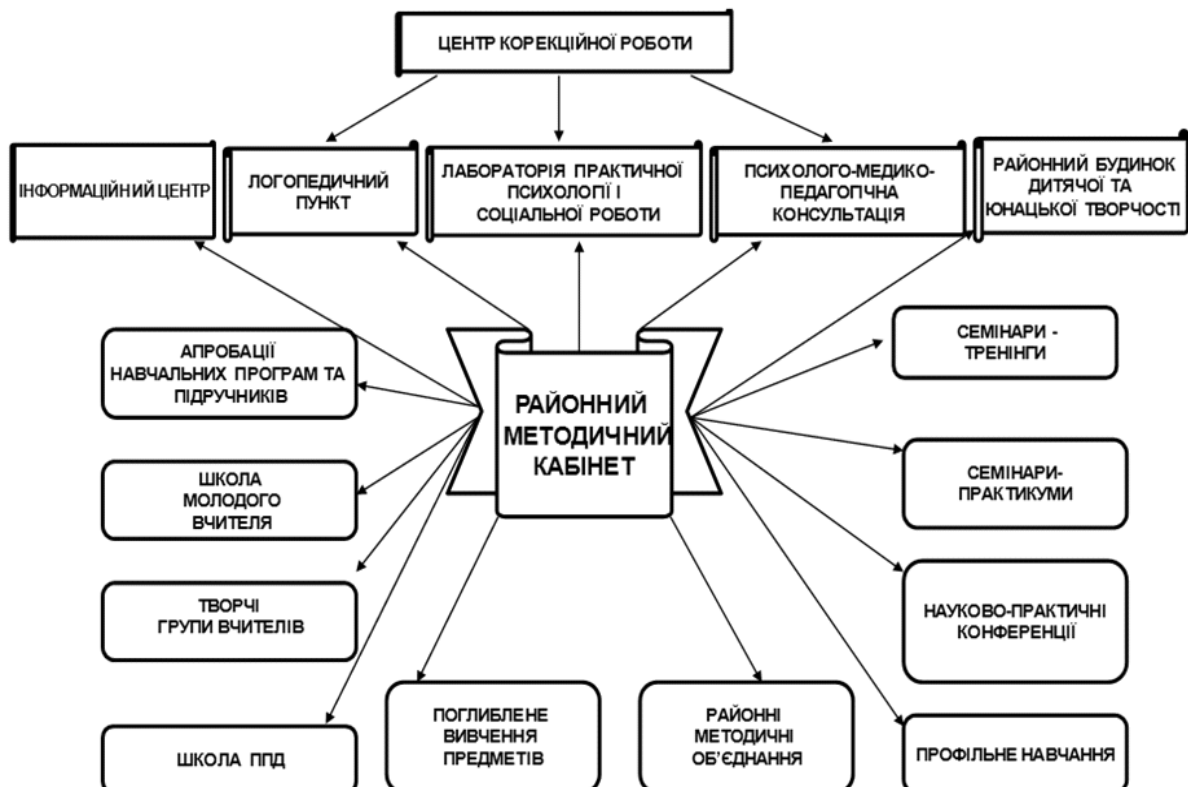
Рис. 1. Форми роботи районного методичного кабінету відділу освіти Полтавської РДА

Ураховуючи специфіку організації науково-методичної роботи в школах сільської місцевості та обмеженість ресурсної бази сільського навчального закладу, необхідність підвищення якості освітніх