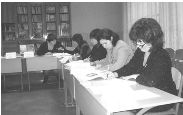
Перший етап самооцінювання в школі № 18 м. Полтави

9. Шкільна культура. Утвердження демократичних цінностей на всіх напрямках діяльності школи. Розкриття інноваційного творчого потенціалу, формування ак-