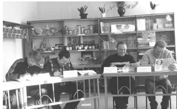
Учасники самооцінювання в Дібрівській школі Миргородського району Полтавської області