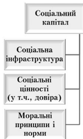
Рис. 2. Структура соціального капіталу (за Р. Патномом)

Р. Патном визначає соціальний капітал як соціальну організацію, мережу, норми поведінки та довіри, що полегшують координацію дій та співпрацю задля спільної користі. За Р. Патномом, соціальний капітал складається з таких компонентів: моральні принципи і норми, соціальні цінності (зокрема довіра), соціальна інфраструктура (насамперед, добровільні асоціації) [3] (див. рис. 2).