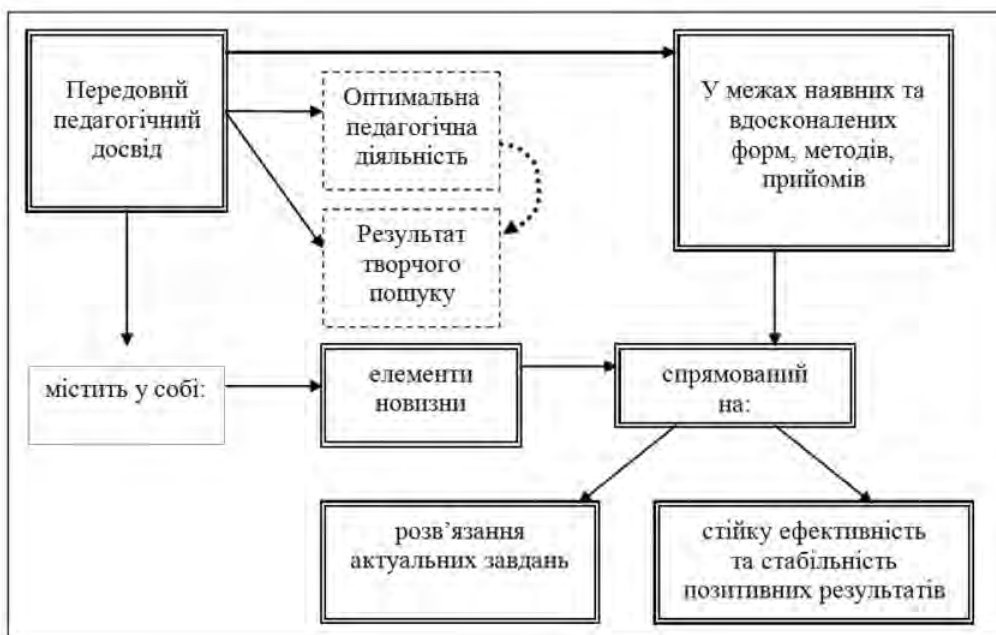
Рис. 1. Схема передового педагогічного досвіду за Ю. К. Бабанським

системи роботи вчителя та поширення прогресивних освітніх ідей, технологій, досягнень сучасної педагогічної науки.