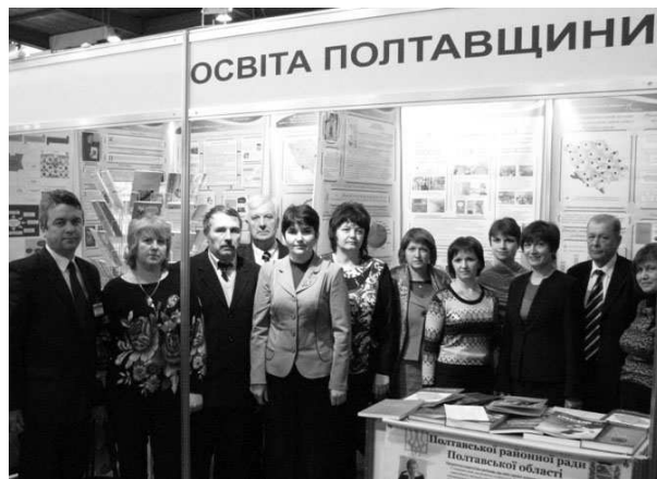
Делегація освітян Хорольського району Полтавської області на Другій Міжнародній виставці «Сучасні навчальні заклади – 2011»

„Puzzle“, „Гринвіч“, „Лукоморье“, „Русский медвежонок“, „Патріот“, „Соняшник“, заочних Інтернет-змаганнях тощо.