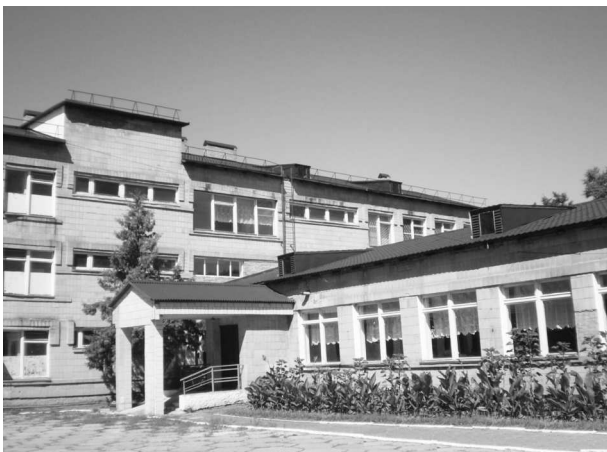
Будівля Хорольської гімназії

Школа як один із найважливіших інститутів соціалізації людини повинна бути уважною до потреб суспільства, до нових реалій і тенденцій суспільного розвитку, нововведень у сфері змісту, форм і методів навчання і виховання. Відповідно, професійну діяльність педагога має характеризувати інноваційність.