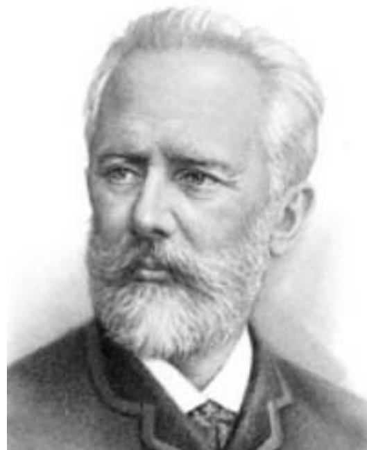
П. І. Чайковський

Прадідом Чайковського по материнській лінії був знаменитий художник-модельєр Майсенської фарфорової мануфактури француз Мішель Віктор Асьє. Майже все його свідоме життя минуло в Саксонії, де він працював на виробництві