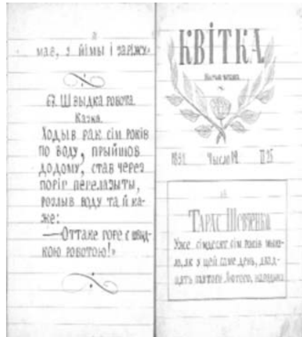
Рукописний журнал «Квітка», що видавався в родині Грінченків

ченко детально описував трагічний випадок із молодим хлопцем Гнатом Проведенком, який хотів піти із економії додому, щоб зашити порваний чобіт, однак прикажчик прив'язав хлопця до воза, і в холодний весняний день Гнат захворів. Згодом, у листі до Х. Алчевської, Грінченко порівнював умови праці селян у економії Алчевських із кріпацтвом.