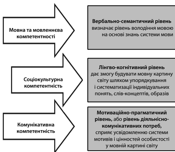
Рис. 2. Рівні володіння мовою (за Ю. Карауловим)

Традиційно в лінгвістиці науковці орієнтуються на трирівневу модель мовної особистості, розроблену Ю. Карауловим (див. рис. 2).