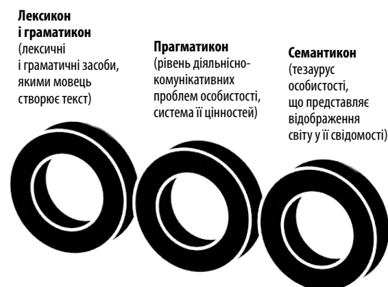
Рис. 6. Рівнева структура формування мовної особистості

становлення (сім'я, її вплив тощо), та її дискурсивною поведінкою (Седов К.Ф., 2004, с. 15).