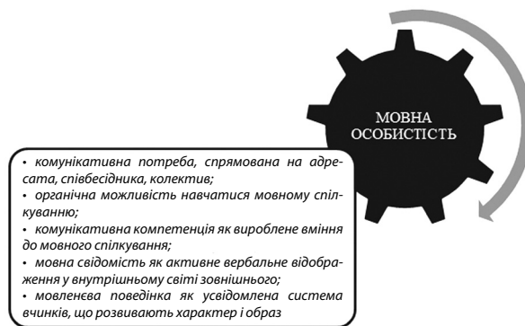
Рис. 3. Аспекти поняття «мовна особистість» (за В. Карасиком)

ливіших аспектів мовної особистості відносить наведені на рис. 3.