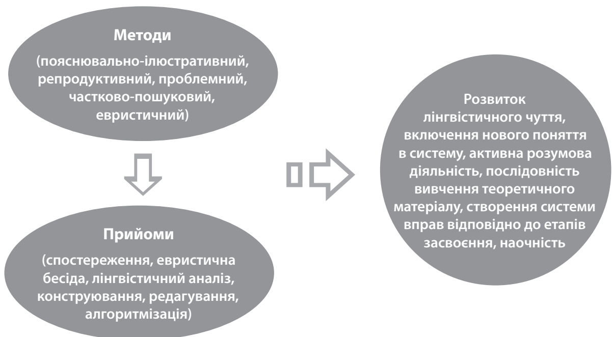
Рис. 1. Методичні умови ефективно організації роботи над формуванням мовних понять в учнів ЗНЗ під час навчання морфології

Показниками засвоєння морфологічного поняття є знання, що допоможуть розрізнити схожі між собою категорії; уміння застосовувати правила та наводити приклади; навички користування знаннями в ситуаціях творчого характеру.