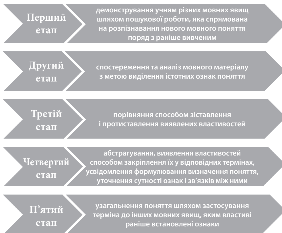
Рис. 2. Етапи засвоєння мовних понять

Серед вправ і завдань, що сприяють формуванню в учнів старшої школи мовних понять, нами було виокремлено такі: