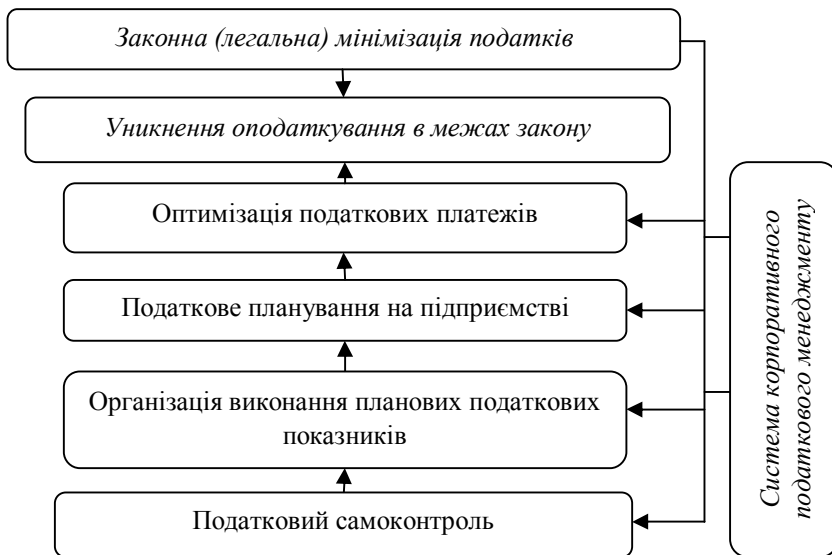
Рис. 3. Схема мінімізації податків у структурі корпоративного податкового менеджменту

Що стосується способів оптимізації податкових платежів, то вони є досить різноманітні. Найбільш поширені серед них: