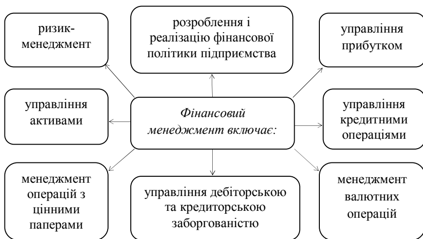
Рис. 2. Управлінський комплекс фінансового менеджменту

Що стосується малого бізнесу, то, вважається, що для таких суб'єктів достатньо кваліфікації бухгалтера чи економіста, оскільки фінансові операції майже не виходять за рамки безготівкових розрахунків. Проте, як свідчить практика, знання багатьох універсальних прийомів, накопичених фінансовим менеджером, можуть бути ефективно використані і в малому бізнесі.