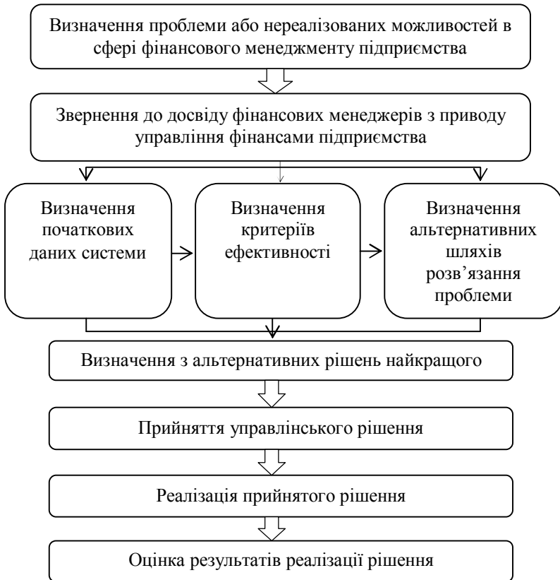
Рис. 3. Система фінансового менеджменту підприємства

На наш погляд, систему фінансового менеджменту підприємства можна представити у вигляді схеми (рис. 3). Визначення проблеми або нереалізованих можливостей виявляється фінансовими менеджерами при оцінці реалізації попередніх рішень або при аналізі фінансово-господарської діяльності підприємства [3, с. 18].