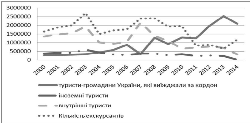
Рис. 3. Динаміка туристичних потоків у 2000–2014 роках за видом туризму, осіб (побудовано за даними [2])

Динаміка туристичних потоків в Україні наведена на рис. 3.