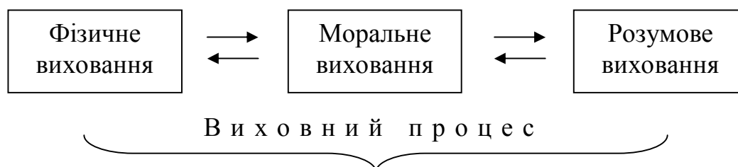
Рис. 1. Формула єдності виховного процесу за Арістотелем

Учень Платона Арістотель (384 р. до н.е. – 322 р. до н.е.) вивів формулу єдності виховного процесу [7], яка графічно зображена на рис. 1.