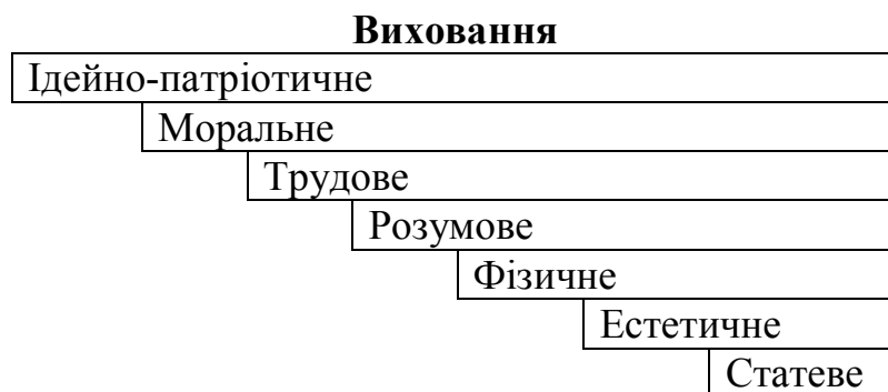
Рис. 4. Складові виховання за Ф. М. Гонолобіним

Досліджуючи взаємовідносини виховання та розвитку дитини Д. Н. Богоявленський, Г. С. Костюк, Н. А. Менчинська відзначають, що розвиток дитини не зводиться лише до засвоєння знань, учіння є одним з внутрішніх процесів, котрі відбуваються в житті дитини [13].