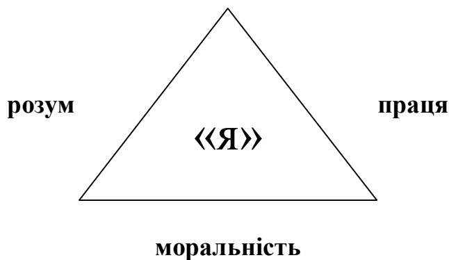
Рис. 2. Модель розвитку особистості

людини. Вимальовується своєрідна модель розвитку, де особистість є індивідуальною, але заключною в рамки «Я», яке прагне вдосконалення, ґрунтуючись на моральності з рівнобічними та рівнозначними сторонами розумового та трудового виховання. Графічно ми зобразили дану модель на рис. 2.