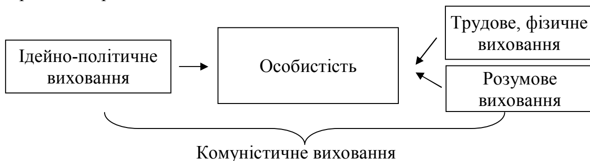
Рис. 3. Модель виховання за І. А. Каіровим

І. А. Каіров, президент Академії педагогічних наук РСФСР, розробив модель виховання особистості, де розумове виховання є своєрідною запорукою якісного виконання трудових вимог та дотримання ідейно-політичних норм комуністичного виховання. Дану модель графічно ми зобразили на рис. 3.