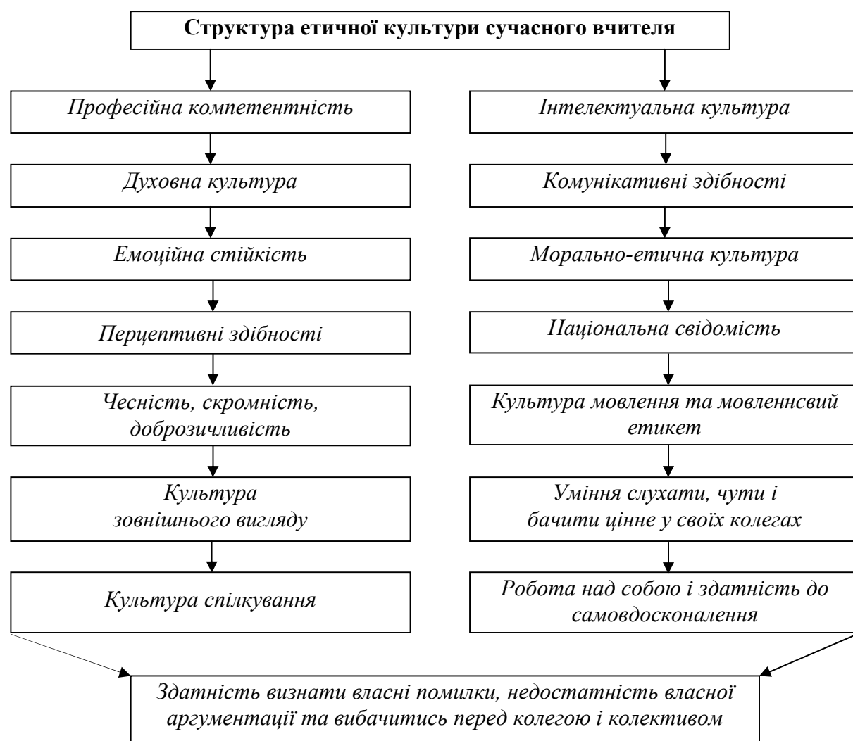
Рис. 2. Структура етичної культури сучасного вчителя

Педагогічна культура – складник етичної культури, яку має також демонструвати сучасний учитель. Її структура представлена нами у рис. 2.