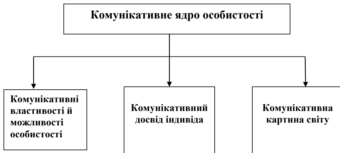
Рис 2. Структура комунікативного потенціалу особистості

Комунікативний потенціал дослідниця трактує як наявність в особистості особистісних якостей, здібностей, комунікативних знань, умінь та навичок, мотивів, які в системі складають комунікативну структуру особистості, її комунікативне ядро та комунікативний світ. Зазначені властивості, розвиваючись та формуючись у спілкування, закріплюються в структурі особистості як своєрідна життєва позиція, яка виконує функцію подальшого вдосконалення реальної комунікативної поведінки.