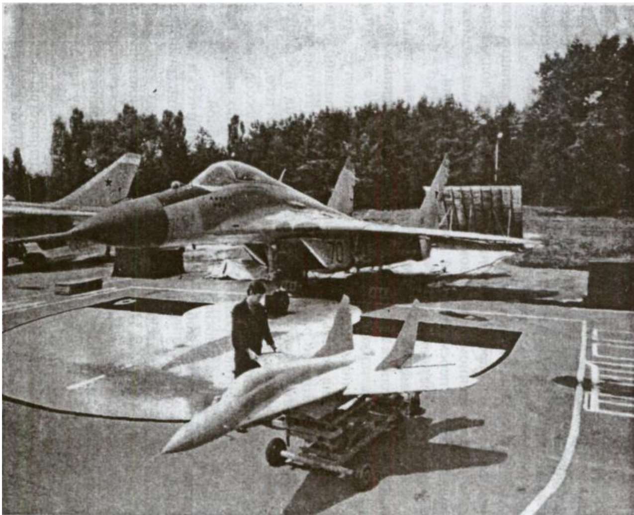
Рисунок 1— Крупномасштабная свободнолетающая динамически подобная модель самолета МиГ-29 и натурный самолет

дель специальными системами аварийного гашения флаттера, а также спасения модели при выходе на критические режимы полета, которые приводят к неизбежному разрушению натурального самолета. Однако для разработки альтернативных вариантов таких устройств прежде всего надо конкретизировать предъявляемые к ним требования, среди которых быстродействие и возможность многократного применения входят в число основных и наиболее трудноосуществимых требований.