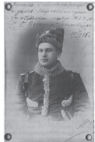
Юрій Юрійович Вороний