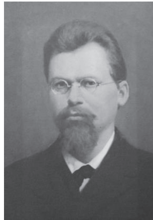
Георгій Федосійович Вороний