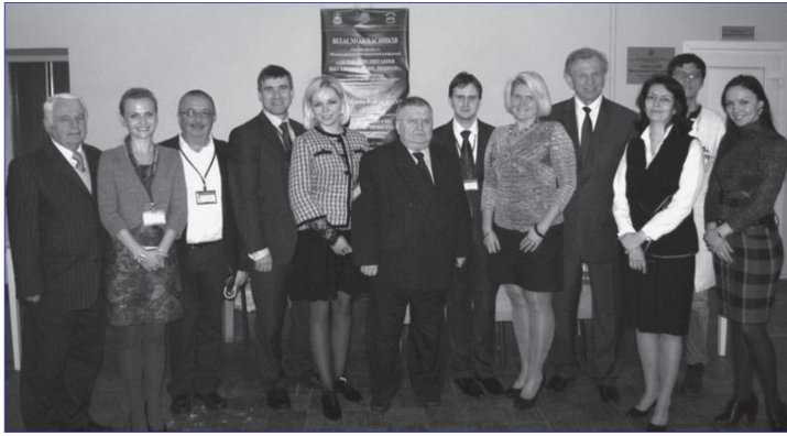
Фото 4. Учасники наукових форумів