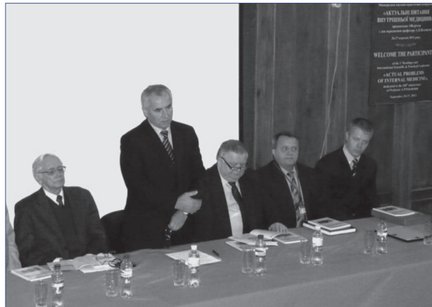
Фото 2. Академік НАМН України, професор В.Г. Майданник вітає учасників із початком роботи наукових форумів

У своїх виступах вони обговорили багато актуальних проблем сучасної нефрології («Ренальна коморбідність у клініці внутрішніх хвороб», «Хронічна хвороба нирок в Україні: проблеми та шляхи їх вирішення», «Використання кето/амінокислот при лікуванні хронічної хвороби нирок IV-V стадій в умовах України», «Трансплантація нирки як міждисциплінарна проблема»), кардіології («Пілотний проект щодо запровадження державного регулювання цін на лікарські засоби для лікування осіб із гіпертонічною хворобою», «Залізодефіцит як нова терапевтична ціль при хронічній серцевій недостатності», «Рефрактерна артеріальна гіпертензія», «Перспективи застосування препаратів магнію в кардіологічній практиці»), ревматології («Сучасні засади фармакотерапії остеоартрозу», «Анемія – коморбідний стан при ревматичних хворобах»), діабетології («Патогенетичні основи терапії цукрового діабету 2 типу», «Актуальні підходи до лікування діабетичної нейропатії», «Особливості ремодельовання серця та їх взаємозв'язки з клінічними, метаболічними й