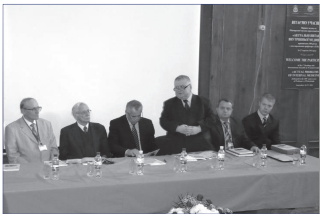
Фото 3. Професор А.С. Свінціцький виступає з доповіддю про основні віхи життя та діяльності професора А.П. Пелешука

гормональними показниками у хворих на гіпертонічну хворобу, асоційовану з цукровим діабетом 2 типу»), пульмонології («Показники біоімпедансометрії у хворих на хронічне обструктивне захворювання легень, поєднане з ожирінням»), гастроентерології («Клініко-діагностичні аспекти хронічних панкреатитів на Закарпатті»), фармакології («Теоретичні та експериментальні дослідження з розробки нових нанопрепаратів») тощо.