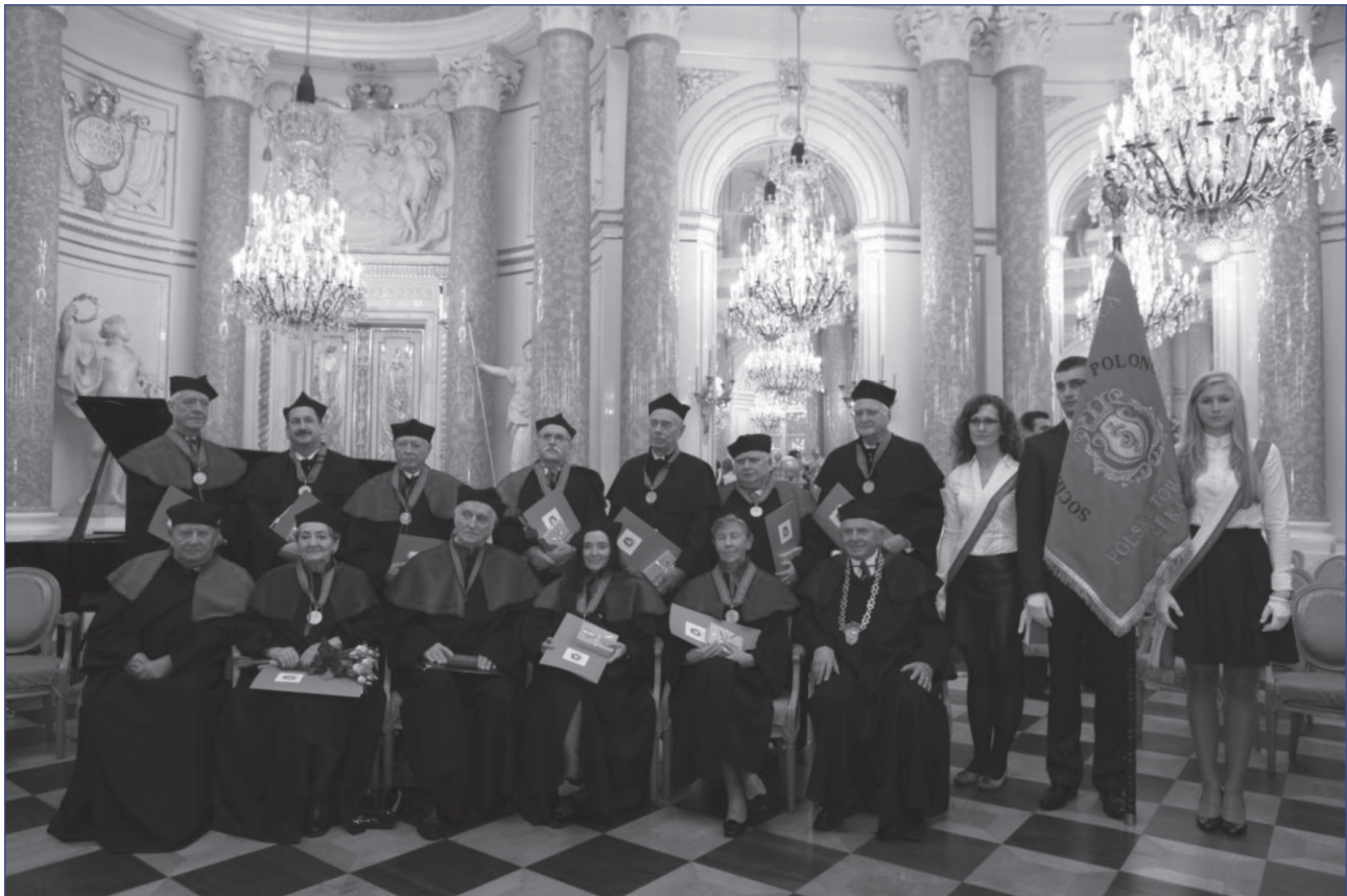
Лауреати 2012 року