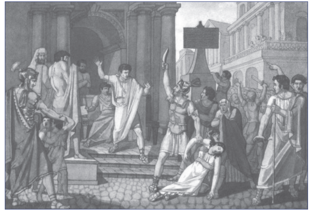
Мал. 3. Смерть Віргінії (1836 р.)

Голодування, постійне вживання морської солоної води та безперервна важка праця ще більше ослабили його організм під час походу до Аральського моря й участі в Аральській експедиції (1848-1849 роки). Водночас у Тараса Григоровича виникли фурункули на тілі, які турбували його й