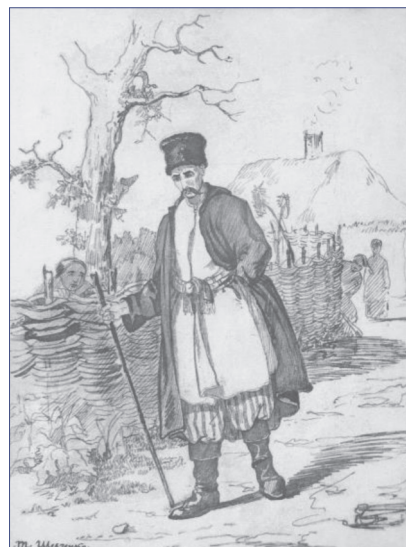
Мал. 4. Знахар (1841 р.)

Останній рік життя Тарас Шевченко провів у невеличкій кімнаті в Петербурзі, де багато займався гравіюванням, використовуючи шкідливі речовини. Здоров'я поета погіршувалося з кожним днем. Протягом січня та лютого 1861 року перебіг хвороби Кобзаря значно ускладнився: посилювалися ознаки серцевої недостатності, почастишали напади стенокардії, почався розвиток набряку легень. Захворювання швидко прогресувало, і 26 лютого (10 березня – за новим стилем) о 5:30 український геній помер. Останню ніч свого життя поет провів, сидячи на ліжку; біль в грудній клітці не давав йому лягти [7].