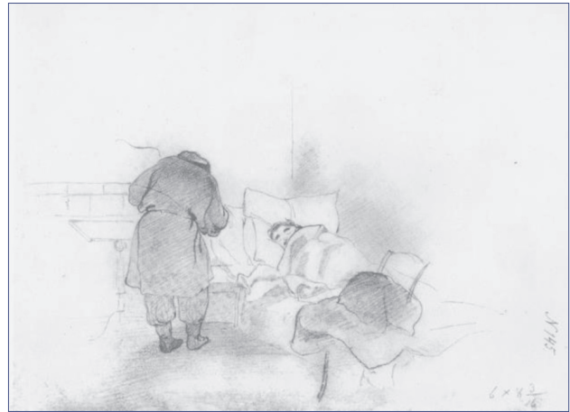
Мал. 5. Біля хворого (1841 р.)

Тарас Шевченко розумів важливість ґрунтовних знань з анатомії людини для художника, тому, навчаючись в Академії мистецтв у Петербурзі, відвідував лекції Іллі Буяльського (10 січня 1841 року був зарахований до списку учнів, яким дозволя-