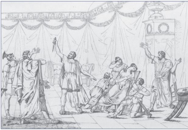
Мал. 2. Смерть Лукреції (1835 р.)