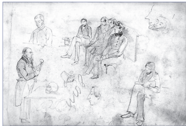
Мал. 6. На лекції з анатомії (1841 р.)