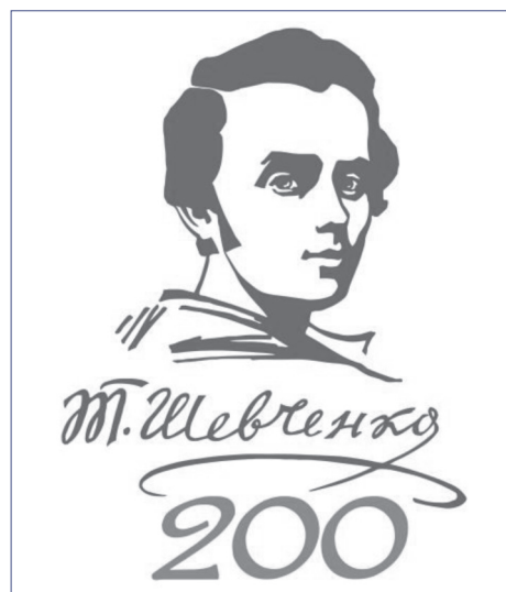
Мал. 1. 2014 рік – Рік Тараса Шевченка

В перший петербурзький період життя у Т.Г.Шевченка діагностували черевний тиф (про що він згадує у повісті «Художник»), який став наслідком пристосування організму до умов північного клімату, виснажливої праці, поганих умов прожи-