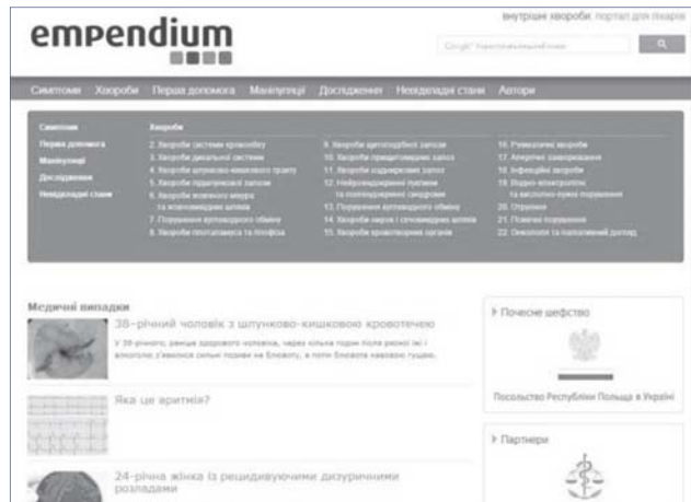
Фото 3. База знань «eMPendium: внутрішні хвороби» ( http://empendium.mp.pl/ua )

євського (Piotr Gajewski) довідник «Внутрішні хвороби – компендіум» («Choroby wewnętrzne – kompendium») – див. фото 1, 2. Варто зауважити, що над його створенням працювали понад 350 відомих науковців із різних університетів і клінік [4].