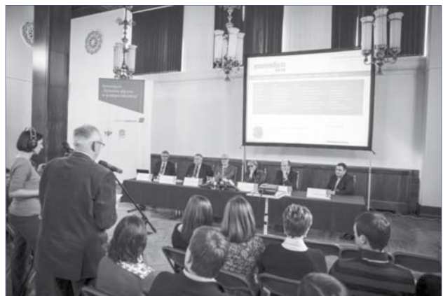
Фото 4. Презентація бази знань «eMPendium: внутрішні хвороби» в рамках симпозиуму «Етичні дилеми в клінічній практиці» у Варшаві (Республіка Польща)

Важливо, що інформація постійно актуалізується: друкований варіант перевидається щорічно, а електронна версія оновлюється одразу після появи нових даних [4, 6, 8].