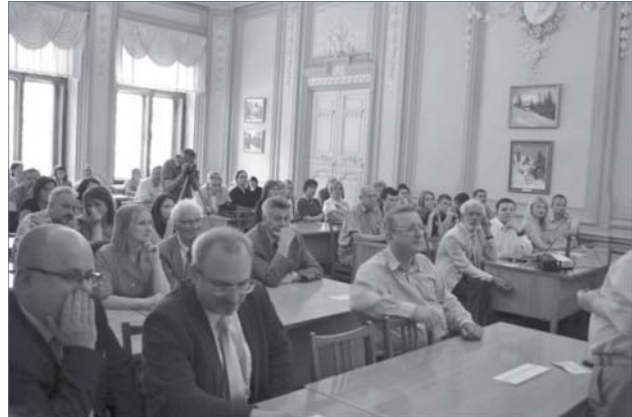
Фото 6. Презентація «eMPendium: внутрішні хвороби» в Києві

Підготовка української версії бази знань «eMPendium: внутрішні хвороби» ( http://empendium.mp.pl/ua ) (фото 3) та українськомовного адаптованого видання довідника професорів А. Щеклика й П. Гаєвського «Внутрішні хвороби – компендіум» («Choroby wewnętrzne – kompendium») тривала понад 2 роки та була завершена на початку 2014 року. Результати спільної роботи польських і вітчизняних фахівців уперше було представлено 3 квітня 2014 року у Варшаві (Республіка Польща) в рамках симпозиуму «Етичні дилеми в клінічній практиці» (фото 4, 5).