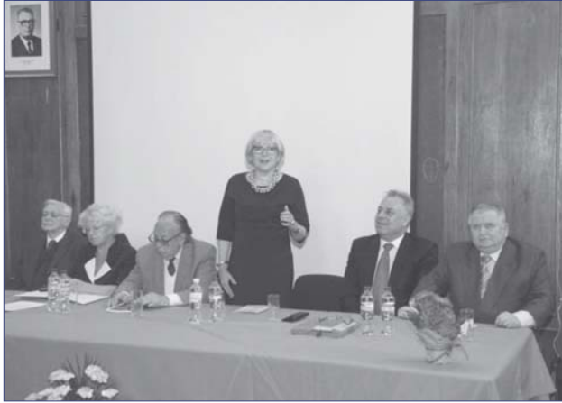
Фото 2. Слова вітання член-кореспондента НАМН України, професора К.М. Амосової до учасників читань і конференції

Завершилася церемонія відкриття неперевершеним виступом соліста Національної заслуженої капели бандуристів України імені Г. Майбороди, кобзаря і поета Я. Черногуза, який продекламував декілька власних поезій та блискуче виконав пісню, підготовлену спеціально до даних форумів.