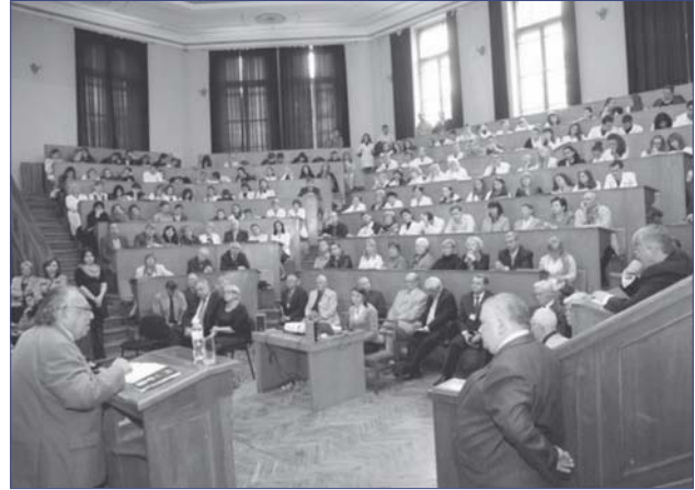
Фото 4. Спогади академіка І.М. Трахтенберга про миті спілкування з професором А.П. Пелешуком

Поділився власними спогадами та враженнями про миті спілкування з професором А.П. Пелешуком й академік НАМН України, член-кореспондент НАН України, професор І.М. Трахтенберг (ДУ «Інститут медицини праці НАМН України»). У своїй промові Ісаак Михайлович (фото 4) зосередив увагу присутніх на багатьох актуальних проблемах сьогодення, згадував їх обговорення і пошук можливих шляхів вирішення спільно з Анатолієм Петровичем та іншими видатними особистостями.