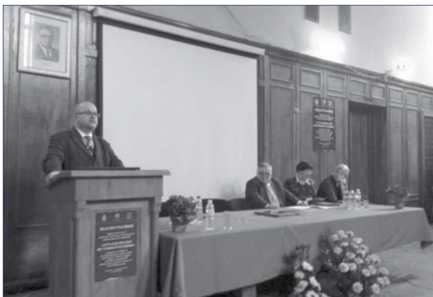
Фото 5. Виступ керівника консульського відділу Посольства Республіки Польща в Україні Р. Вольського

У рамках конференції також були ще проведені два інші заходи: симпозіум «Засади доказової медицини в практиці лікаря-інтерніста» та презентація української версії бази знань «eMPendium: внутрішні хвороби» ( http://empendium.mp.pl/ua ) – сучасної освітньої платформи, що базується виключно на даних із найвищим рівнем доказовості та містить положення новітніх клінічних рекомендацій,