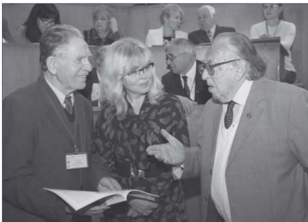
Фото 6. Спілкування в кулуарах наукових форумів