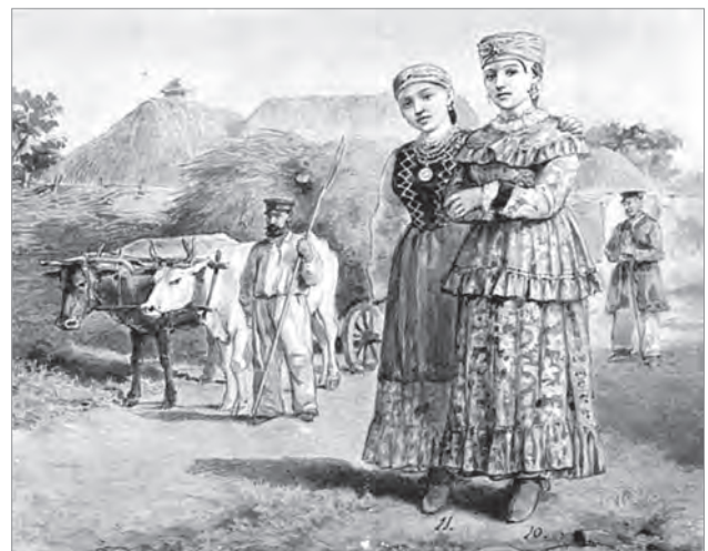
Українки з Бірюцького повіту наприкінці XIX сторіччя