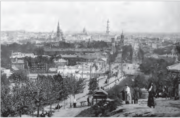
Харків. Загальний вигляд з Холодної гори