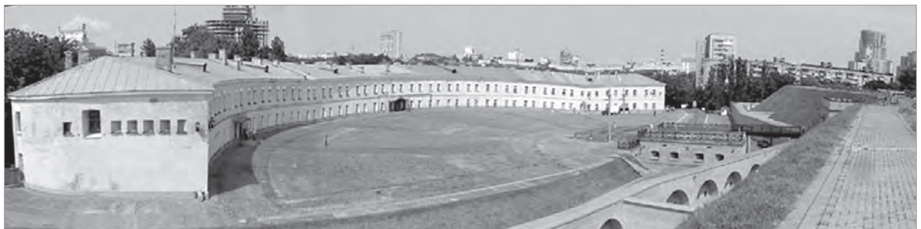
Сучасна панорама Київського військового шпиталю (нині — Головний військовий клінічний шпиталь МО України)