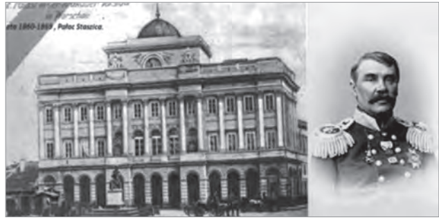
Варшавська медико-хірургічна академія знаходилась у палаці Сташиця (нині – Польська академія наук)