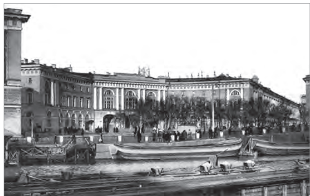
Міністерство народної освіти, Петербург

дичному факультеті. Із початку становлення Київської школи внутрішньої медицини інтерніст Ф.С. Цицурін наполегливо впроваджує в її діяльність наукове дослідне пізнання. Йому вдається вже в 1844-1845 навчаль-