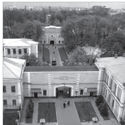
Київський головний військовий шпиталь сьогодні

Тим часом, за обставин невпинного збільшення на медичному факультеті Університету св. Володимира кількості студентів [37], здійснювати належно клінічне викладання у відділеннях, де нараховувалось від 8 до 16 стаціонарних ліжок, було абсолютно неможливим. Тому іще у 1845 році спробували об'єднати університетські клініки з Кирилівською міською лікарнею. Але через відсутність коштів цей задум так і залишився нездійсненим. На щастя, вихід було віднайдене в заснуванні університетських клінік на базі Київського військового шпиталю [36]. Організаційно це було вдале та, зрештою, єдино можливе за тих обставин вирішення проблеми. Основним було те, що це був гарантована