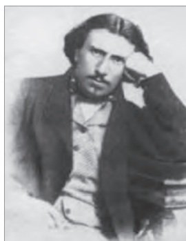
Микола Семенович Лєсков

Саме в будинку свого дядька, що знаходився по вулиці Мала Житомирська, 20, Микола Лєсков близько зійшовся з добрим товаришем родини Алфер'євих, а для нього як вільного слухача університету — авторитетним лектором і професором Олександром Пе-