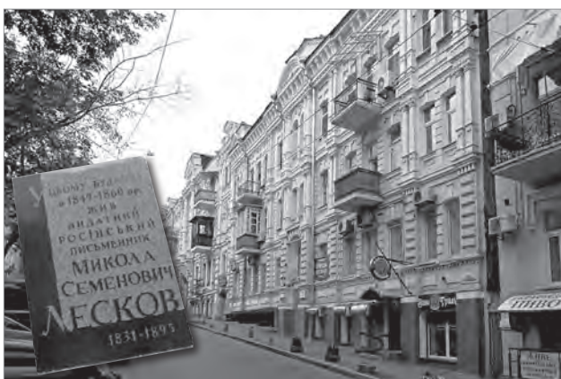
Мала Житомирська, 20