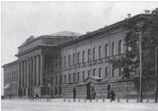
Вхід до північної частини головного корпусу Університету св. Володимира, де розташовувалась університетська клініка

Відмітимо й те, що відкриття перших університетських клінік започаткувало одну з перших традицій Київської клінічної школи з милозвучною назвою