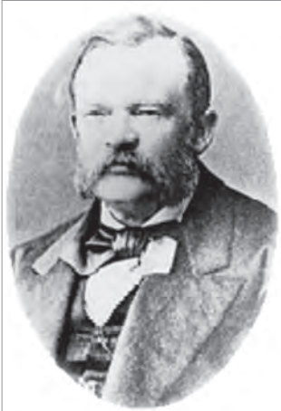
Горецький Людвіг Казимирович

Горецький Л.К. почав викладати клінічну медицину на посаді ад'юнкта по кафедрі приватної патології та терапії в повному обсязі зі шпитальною клінікою. Людвіг Казимирович у 1864 році заснував у Київському військовому шпиталі одне з перших у Російській імперії відділень «нашкірних хвороб», яке стало клінічною базою заснованої ним першої в Україні кафедри та школи дерматології й сифідології.