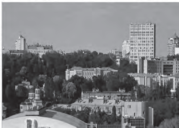
Панорама Олександрівської лікарні крізь сторіччя

нин», посилаючись саме на розрахунки Ю.-Ф.І. Мацона, привернула увагу медичної громадськості на гостру необхідність для хворих міста Києва 1200-1300 стаціонарних ліжок у лікарнях [23 (с. 77)]. На той час їх було тільки 450-500, але й ті через відсутність будинків для людей похилого віку були зайняті здебільшого геронтологічними пацієнтами з хронічними захворюваннями. І зовсім не випадково саме професор Ю.-Ф.І. Мацон став одним з ініціаторів та організаторів будівництва, а відтак очільником Олександрівської лікарні (нині — Центральної міської клінічної лікарні) [24, 25].