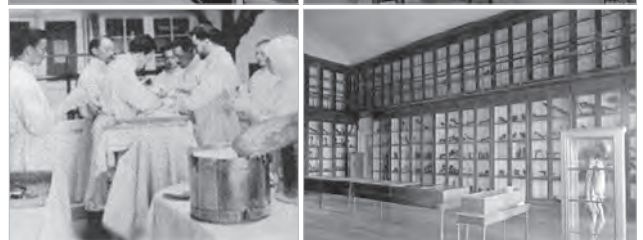
Панорама Анатомічного театру Університету св. Володимира на початку ХХ сторіччя