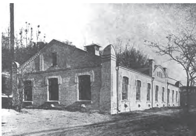
Пральня Олександрівської лікарні. Світлина 1910 року

За період керівництва професором Ю.-Ф.І. Мацоном Олександрівська лікарня стала показовою в Південно-Західному регіоні. Нововведенням була розроблена ним прогресивна на той час форма керівництва лікарнею. Його здійснювала Рада, до якої входили головні спеціалісти та завідувачі відділень. Професор Ю.-Ф.І. Мацон домогся відкриття при лікарні пральні та дезінфекційної камери, що була спроможна знешкоджувати речі хворих лікарні (а в разі необхідності — й інших громадян [23 (с. 77)]). Олександрівська лікарня з перших років своєї діяльності виконувала найвідповідальніші та гуманні функції. Колектив лікарні брав участь у наданні допомоги пораненим під час Сербо-Чорногорсько-Турецької війни 1876-1878 років [14]. У великій мірі саме завдяки старанням свого очільника, доктора медицини, досвідченого клінічного викладача професора Юлія-Фердинанда Мацона Олександрівська