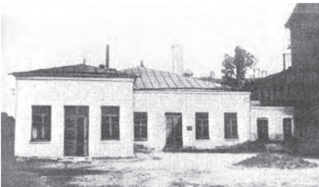
Прозекторій Київського військового шпиталю