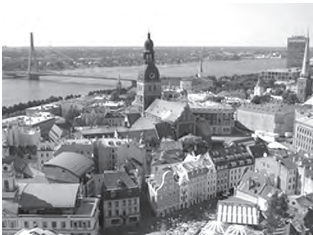
Сучасний вигляд на історичний центр Ризи