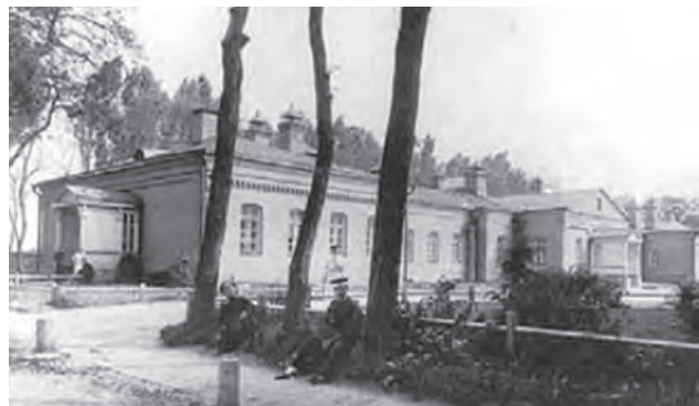
Один із корпусів Київського військового шпиталю в кінці XIX сторіччя