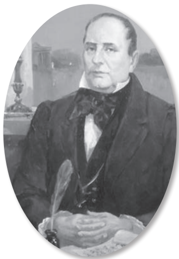
Академік Остроградський М.В. [http://uahistory.com/topics/famous_people/2712]

сії клініко-експериментальну лабораторію. І це був надважливий поступ. А І.М. Сеченову за підтримки І.Т. Глебова вдається заснувати в академії одну з перших у Росії модерних фізіологічних лабораторій. І тут Івану Михайловичу особливо стала в пригоді здобута ще до навчання на медичному факультеті Московського університету солідна інженерна та фізико-математична освіта. У 1848 році він здобув диплом випускника Головного (військового) інженерного училища. Навчаючись в училищі, він захоплювався лекціями академіка Остроградського Михайла Васильовича і став одним із його послідовників. Бунтівний нащадок козацько-старшинського роду Остроградських, який походить із Пашенівки (нині — Козельщинський район Полтавської області), був одним із провідних математиків світу в середині XIX сторіччя. Михайло Васильович викладав математику та фізику у вищих навчальних закладах Франції та Росії [29, 30]. Він все життя пам'ятав батькові розповіді про своїх пращурів, які вели родовід від славних князів Острозьких та