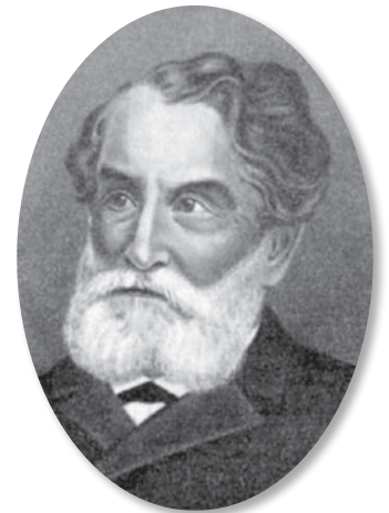
Професор Глебов І.Т.

С.П. Боткін та М.І. Сеченов прибули до Петербурга в 1860 році на запрошення віце-президента Імператорської медико-хірургічної академії професора Івана Тимофійовича Глебова — свого наставника періоду навчання в Московському університеті [28]. Свою діяльність у ній вони розпочинають з успішного захисту підготовлених під