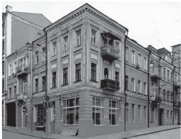
Будинок № 18/1 на розі вулиць Прорізної та Паторжинського