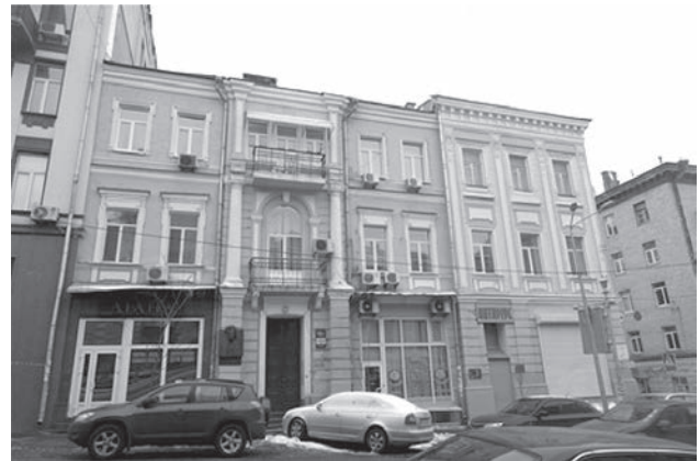
Сучасний вигляд реконструйованої родинної кам'яниці професора В.Т. Покровського

свій час він проводив у шпиталі і багато працював безпосередньо в клініці з пацієнтами. Він постійно вдосконалювався та набирався практичного досвіду фахівця з лікувальної справи. Таким чином, професор В.Т. Покровський швидко спростував всі побоювання відносно того, що за доброї підготовки в теоретичному плані «...якості і досвідченість практичного лікаря в ньому погано гарантовані» [42]. Дуже швидко всі переконалися у протилежному і він став одним із найпопулярніших у Києві лікарів-практиків. Його діагностика базувалась на великому запасі наукових відомостей і була успішною. Застосовуючи науково-дослідне пізнання, Василь Тимофійович успішно розпізнавав рідкісні на той час хвороби. Судячи з того, що вже в серпні 1871 року Василь Тимофійович придбав чималу садибу на розі вул. Васильчиковської (тепер вул. Прорізна) та пров. Михайлівського (тепер вул. Паторжинського) [43] й одразу ж розпочав будівництво родинної кам'яниці (вона збереглась до сьогоднішнього дня), він бажав бачити своє майбутнє саме серед соратників та побратимів по київській медичній спільноті.