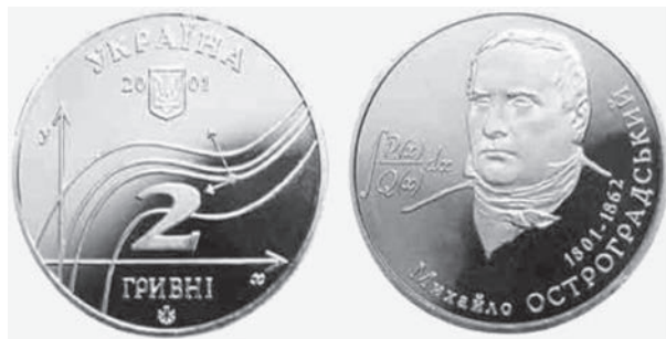
Пам'ятна монета присвячена 200-річчю з дня народження видатного українського вченого-математика, академіка п'яти академій (Паризької, Санкт-Петербурзької, Римської, Туринської й Американської) Михайла Васильовича Остроградського

звитягу прадіда Матвія – миргородського полковника, заарештованого разом із Павлом Полуботком за наказом Петра I. Тож і його у 1821 році, за доносом «пильних людей» на викладача-вільнодумця за нечувану сміливість читати у своїй alma mater лекції з математики українською мовою, позбавили наукового ступеня, відібрали університетський атестат та звільнили з роботи. У 2001 році визначний український учений академік М.В. Остроградський внесений ЮНЕСКО до списку видатних математиків світу. У серпні того ж року Національний банк України з ініціативи Харківського університету випустив пам'ятну монету «Михайло Остроградський» із серії «Видатні діячі України».