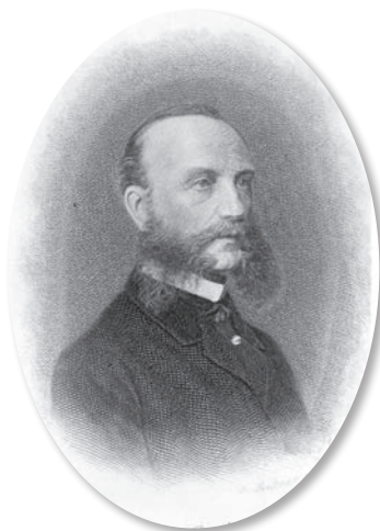
Професор Вільгельм Грізінгер

Вищевикладене переконливо засвідчує, що на очолюваній професором В.Т. Покровським кафедрі були створені всі належні умови для запровадження систематичного клінічного викладання суміжних із терапевтичними хворобами дисциплін («спеціальної патології») як самостійних. Мова йде насамперед про вчення про шкірні висипи, нервові та душевні хвороби, а також патологію верхніх дихальних шляхів. І це був значний поступ. Так було започатковував витоки клінічного викладання в Україні одразу чотирьох важливих клінічних медичних дисциплін: дерматовенерології, неврології, психіатрії та отоларингології. Зазначимо, що вичитування лекційного курсу з трьох останніх дисциплін керівник університетської терапевтичної клініки професор В.Т. Покровський здійснював особисто [2]. Харизматичний Василь Тимофійович наполегливо працював над поглибленням своїх знань і вперто удосконалювався як інтерніст. У 1868 році він