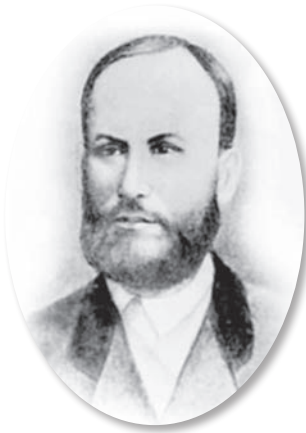
Професор В.Т. Покровський

молодшого ординатора Київського військового шпиталю «с денежным и другими видами обеспечения за должностью» [15]. Уродженець Калужської губернії Василь Тимофійович Покровський (3 березня 1838 — 14 січня 1877) народився в родині сільського священика [3, 11, 15, 16, с. 554-556; 17, с. 89]. Будучи вихованцем Калужської духовної семінарії, він все ж обирає тернистий шлях фахівця з лікувальної справи і в 1856 році казеннокоштным студентом вступає до Імператорської медико-хірургічної академії. У 1861 році Василь Тимофійович із золотою медаллю закінчив навчання в академії й здобув диплом лікаря з відзнакою. Як кращого з кращих його залишають для удосконалення при академії ще на три роки (щоправда, тільки на посаді позаштатного лікаря 2-го військово-сухопутного Санкт-Петербурзького шпиталю). І тут, окрім даного Василю Тимофійовичу провидінням через родовід Покровських таланту та працелюбності, для нього винятково вдало склались сприятливі обставини для становлення як фахівця з внутрішньої медицини за спеціалізацією «приватна патологія і терапія».