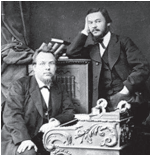
С.П. Боткін та І.М. Сеченов (світлина 1860-х років)

Щодо цього пригадаємо, що саме на початку 60-х років окрилині та повні натхнення після стажування в європейських університетах Сергій Петрович Боткін та Іван Михайлович Сеченов запроваджують в Імператорській медико-хірургічній академії модерні засади науково-дослідного пізнання в лікувальній справі. Із позиції історичної ретроспективи також бачимо, що саме з їх іменами пов'язане постановня перших знакових російських національних медичних шкіл [18-20]. Їх діяльність стала «найкращим уособленням законного і плідного союзу медицини та фізіології — тих двох різновидів людської діяльності, які на наших очах споруджують будинок науки про людський організм і обіцяють у майбутньому забезпечити людині її найкраще щастя — здоров'я і життя». Ось так влучно та з гордістю сказав про сутність діяльності своїх знаменитих наставників перший серед російських учених Нобелівський лауреат І.П. Павлов [21]. Саме за сприяння С.П. Боткіна та І.М. Сеченова Іван Петрович і був запрошений завідувати експериментальною лабораторією клініки внутрішніх захворювань академії, ще будучи її студентом 5-го курсу (тут потрібно мати на увазі, що ще до навчання в медичному виші він із відзнакою закінчив Санкт-Петербурзький університет) [22]. Оскільки формування особистостей видатних учених-медиків С.П. Боткіна та І.М. Сеченова і становлення їхніх шкіл в умовах тодішньої дійсності Російської імперії є знаковим [18-27], то хоч і коротко, але все ж давайте розглянемо їх генез.