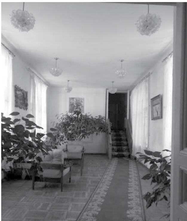
Фото 2. Хол для відпочинку. Сходи ведуть до житлових приміщень (2016 р.)

У 1934 р. бібліотека переміщується в будівлю університетської бібліотеки по вул. Володимирській, 58. Важливим моментом в історії цього закладу було те, що серед перших її читачів були видатні вчені-медики: О.О. Богомолець, М.Д. Стражеско, О.П. Кримов, І.М. Міщенко, Б.М. Маньківський, Д.М. Думбадзе, М.С. Спіров, В.Ю. Чаговець, Д.Ф. Чеботарьов, Я.П. Фрумкін, Н.В. Лауер (Бажан).