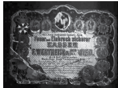
Фото 6. На дверях сейфа збереглася торгова марка австрійської фірми, яка збудувала цей сейф (2016 р.)

Колективу бібліотеки довелося докласти величезних зусиль, аби врятувати від знищення цю перлину архітектури. У 1969-1971 рр. за проектом фахівців інституту «Укрпроектреставрація» було здійснено реставрацію будинку з відновленням його інтер'єрів. Співробітники бібліотеки відновлювали будинок в оригінальному вигляді за малюнками й світлинами, віднайденими в архівах. Вони дбайливо охороняли та продовжують обережно ставитися до апартаментів, меблів, шаф, столів, сейфів та інших предметів, які належали родині Терещенків, як до надзвичайно цінних скарбів (фото 5, 6).