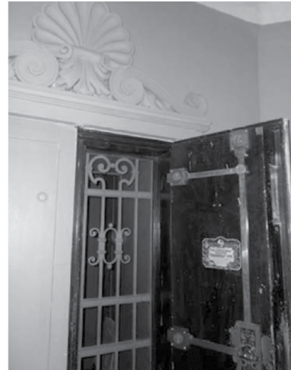
Фото 5. Сейф для зберігання цінностей (2016 р.)

З 1969 р. будівлю на вул. Толстого, 7, яка знаходилася тоді в напівзруйнованому після пожежі стані, було передано Державній науковій медичній бібліотеці УРСР. Кажуть, у той час вже було розроблено проект зведення на місці маєтку висотної адміністративної будівлі на 22 поверхи.