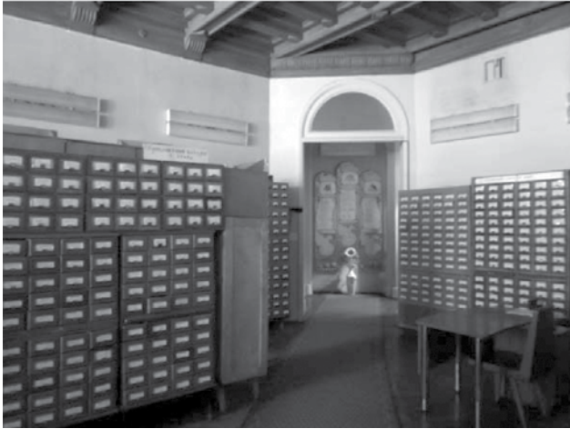
Фото 4. Зал для розміщення каталогів (2016 р.)

на. Вони працювали до 1955 р. У штаті бібліотеки на той час було 55 співробітників. Остаточне завершення становлення бібліотеки як центру бібліотечно-бібліографічного обслуговування медичних працівників і організаційно-методичного керівництва мережею медичних бібліотек УРСР припадає на другу половину 50-х років, коли установу очолили Ф.Л. Хмара і П.В. Коломієць. Професіонали найвищої кваліфікації, високоосвічені та віддані своїй справі, вони розробили стратегічний план розвитку бібліотеки і мережі медичних бібліотек нашої країни. Завдяки їм у стислий термін було створено ефективну систему методичної допомоги на місцях, організовано обмін досвідом роботи медичних бібліотек різних рівнів, активізовано контроль за їх діяльністю. Мережа охоплювала понад 800 медичних бібліотек УРСР і була найбільшою в колишньому СРСР. Наприкінці 60-х років довідково-інформаційні фонди бібліотеки вже нараховували близько 800 тис. друкованих одиниць, але сама бібліотека продовжувала існувати в непристосованому, напівпідвальному приміщенні житлового будинку по вул. Горького, 19/21. Під книгосховища орендували 13 підвалів у різних місцях Києва (по вулицях Саксаганського, Дарвіна, Заньковецької тощо).