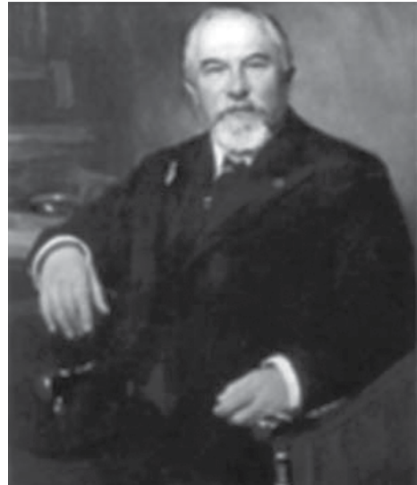
Фото 1. Олександр Миколайович Терещенко

Після жовтневого перевороту в 1918-1919 рр. майно родини було конфісковано, будинок націоналізовано. Членам сім'ї залишили тільки кімнати на другому поверсі. Нині збереглися сходи, які колись вели до житлових приміщень на другому поверсі (фото 2).