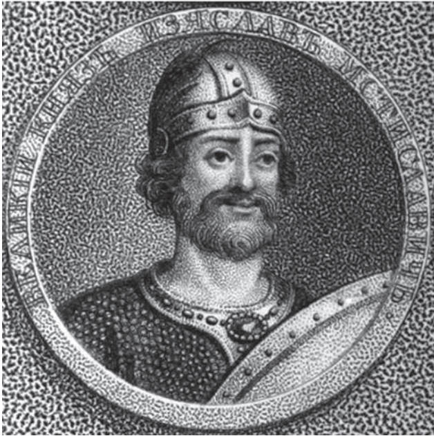
Ізяслав II Мстиславич, великий князь Київський