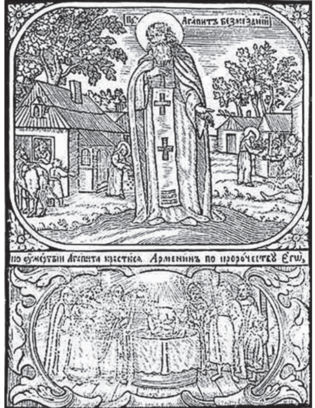
Зроблений гравером Києво-Печерської лаври Іллею іконографічний портрет Агапіта, надрукований у «Патерику Печерському» 1661 року