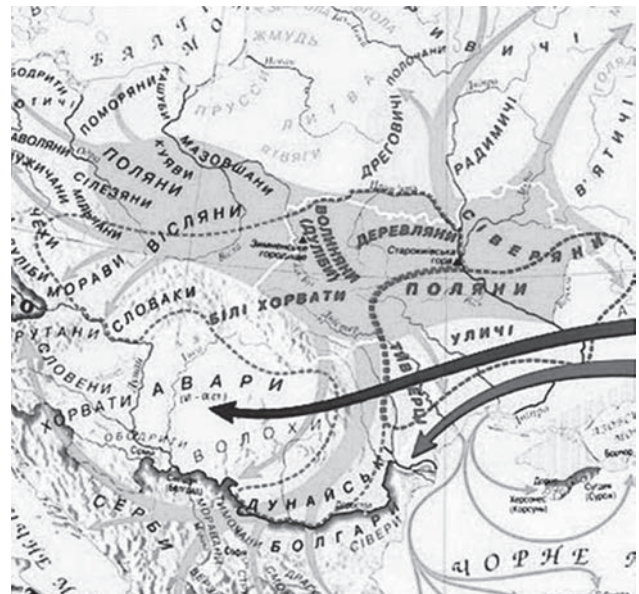
Мапа розселення слов'янських племен у VII ст.

дом за відступаючими франками на захід від річок Вагу та Морави подалися чехи (морав'яни), які захопили Швабію та Франконію, а в Баварії дійшли до річки Манн. Тим часом серби перемістились у Саксонію [28]. У 662 році князь Самослав помер, і його держава за тогочасної феодалної дійсності