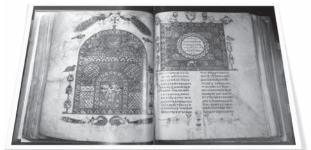
Сторінки «Ізборника Святослава»