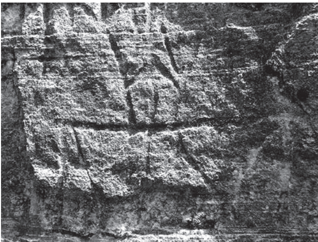
Петрогліф в язичницькому храмі Стільського городища

ципах її природовідповідної чи екологічної поведінки). При цьому суттєвою частиною давньо-язичницьких емпіричних пізнань наших предків були саме способи лікування. Досить обмежені дані, що отримані з археологічних розкопок, бувальщин (билин), сказань, рукописів чужоземних мандрівників (наприклад, Геродота) та літописів, свідчать, що саме в язичеський період були закладені основи застосування в народній медицині зільництва, вербальної магії та мануальних вправлянь. Приблизно в ті часи з'являються й перші лікувальні середники з продуктів землеробства й тваринництва. Прадавні перекази про чудодійну «живу воду» можуть свідчити, що знахарям тих часів було відомо про лікувальні властивості мінеральних вод. Носіями цих знань були виключно служителі дохристиянських культів і знахарі. В їхній практиці шляхом емпірики відбулось становлення примітивних підходів до вербального впливу. Загалом вербальну магію, яку можна вважати першими паростками психотерапевтичного впливу, визначають характерною особливістю для наших теренів. Вона базувалася на язичницьких традиціях — заговорах, позбавленні від «порчі»