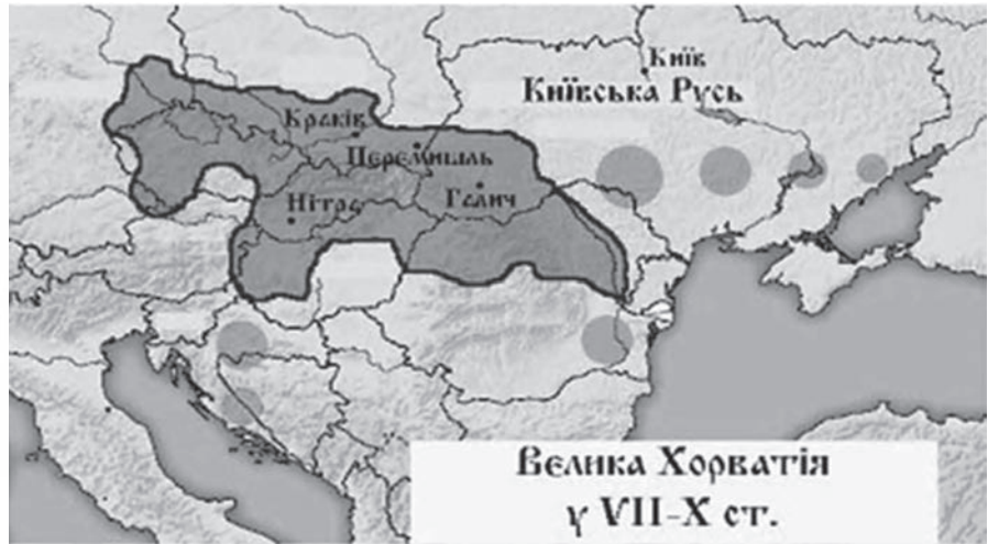
Терени держави хорватів

рез Клісу та Салону й цим поклали початок завоюванню Далмації. Друга хвиля хорватів заповонила Балкани в 626–630 роках і завершилась остаточним завоюванням Далмації.