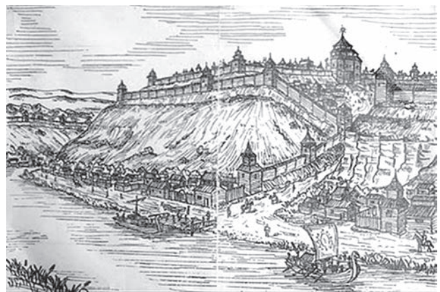
Резиденція князя Самослава — Стільсько

Чільним етносом Карпатської Хорватії були карпатські (білі) хорвати. Та перемоги князя Самослава дали можливість усім слов'янським етносам у завершальний період великого переселення переміститись у глибину Європи. Так, після переможної битви князя Самослава під Унгостом слі-