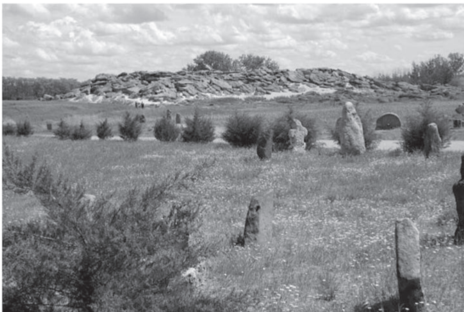
Національний історико-археологічний заповідник «Кам'яна Могила» — світова пам'ятка давньої культури в Україні поблизу Мелітополя (сmt Мирне) у Запорізькій області понад річкою Молочною

Дослідне пізнання українців своїм корінням сягає сивої давнини. За доби язичництва в трипільський, скіфський, сарматський періоди і в дохристиянські часи перших давньоруських держав Карпатської (Білої, Великої) Хорватії (VI-X ст.) і Київської Русі (IX-XIII ст.) пізнання наших предків набувались за безпосереднього контакту з навколишнім середовищем і носили емпіричний характер. Перші відомості про них віднаходимо в петрогліфах «Кам'яної могили» (XII-XIV тисячоліття до н.е.) [7] Стільського городища та Пліснеського археологічного комплексу VII-IX сторіччя [8-12]. Потрібно розуміти, що праукраїнський етнос тисячоліттями формувався на перехресті головних шляхів між Європою та Азією. Щодо цього Norman