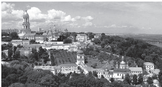
Сучасний вигляд Києво-Печерської лаври

Вагомий внесок щодо систематизації емпіричних пізнань (здебільшого медичних) та становлення монастирської медицини Київської Русі зроблено в Києво-Печерській лаврі. Монастир цей був заснований у 1051 році. В унікаль-