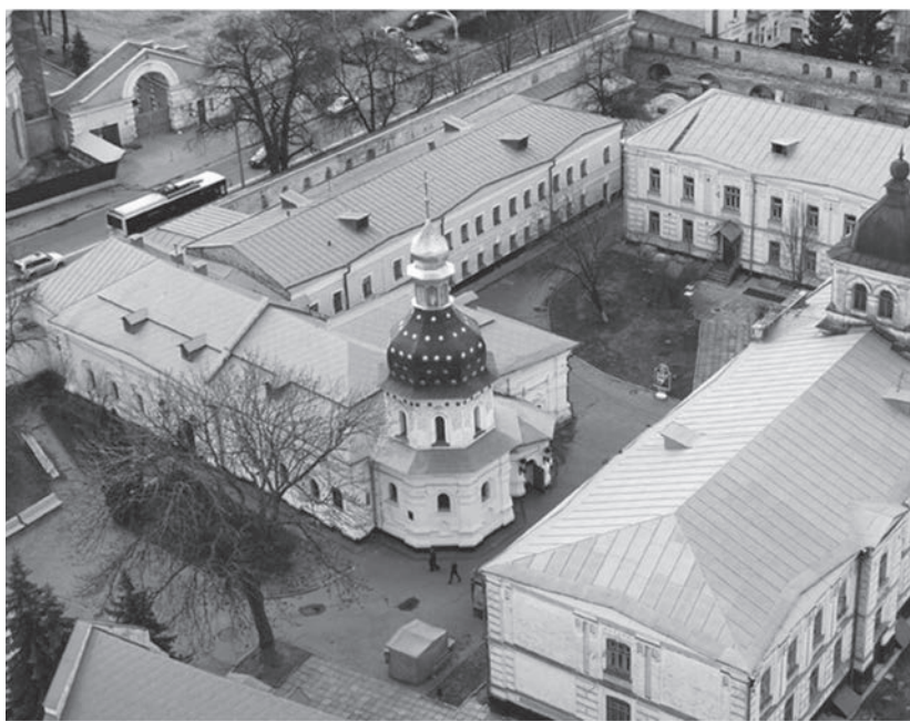
Загальний вигляд Микільського шпитального (Троїцький Больницький) монастиря

Дотепер дійшли легенди про надзвичайний лікувальний хист монастирського лічця по імені Агапіт. Він завоював особливу прихильність киян завдяки «безмездной», тобто безкоштовній, лікарській допомозі городянам. У патерику повідомляється й про іконописця Алімпія, котрий допомагав хворим із шкірними захворюваннями, пресвітера Даміана, який «спеціалізувався» на лікуванні дітей, Григорія-чудотворця, що мав особливу силу «на бісів» і допомагав психічно хворим. До нашого часу в Ближніх печерах Києво-Печерської лаври збереглася перша «Келія біснுவатих», яку можна вважати першою вітчизняною «психотерапевтичною клінікою». Власне, у Печерському монастирі князь Микола Святоша у XII столітті заснував перший шпиталь для хворих монахів і заклад для ченців-інвалідів [93, 101, 102]. Приймавши після одужання чернечий постриг, він переносить монастирську лікарню на інший бік обителі і розширює її настільки, що утворюється цілий лікувальний монастир. На честь небесного покровителя засновника лікарні Миколи Святоші він отримав назву Микільського. Архітектуру його храмових споруд було адаптовано таким чином: ліворуч — лікарняна палата, пра-