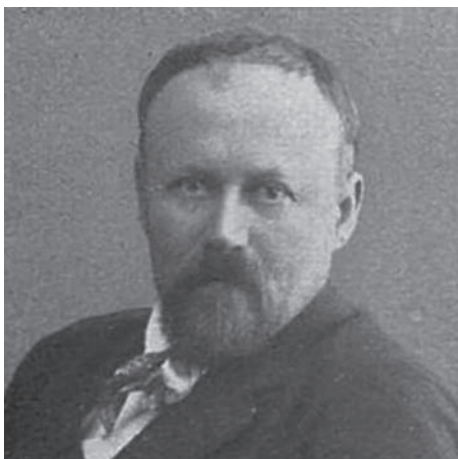
Заболотний Данило Кирилович, президент ВУАН у 1928-1929 роках, академік АН УРСР, професор

Сьогодні офіційні (із належним правовим статусом) організаційні структури, що реалізують діяльність наукових корпорацій, вирізняються своєю різноманітністю. Серед них академії, університети, науково-дослідні інститути, наукові товариства, науково-виробничі центри, тимчасові наукові колективи тощо. І ось у листопаді цього року знаменна в нашій історії подія — 27 листопада 2018 року виповнюється 100-річчя заснування Національної академії наук України (НАН України) [1-3]. Остання й на сьогодні є вищою науковою самоврядною організацією України та залишається найбільшим центром наукових