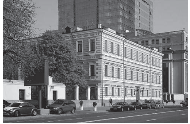
Приміщення Президії НАН України на вулиці Володимирській № 54 в Києві