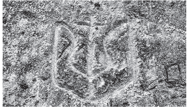
Тризуб, висічений на скелі поблизу печери в Ілві, околицях Стільського городища.

чів», тобто Тризуб [66]. Тож очевидно, що зовсім не випадково дружиною Ярослава Мудрого стала шведська принцеса Інггерда (св. Анна Новгородська), мати якої — королева Естрід — до заміжжя була ободритською княжною [61]. Не тільки пам'ятали київські князі свою родословну, але шанували й продовжували свою традицію. І тут пригадаємо, що слов'янські етноси змогли в завершальний період великого переселення [67]