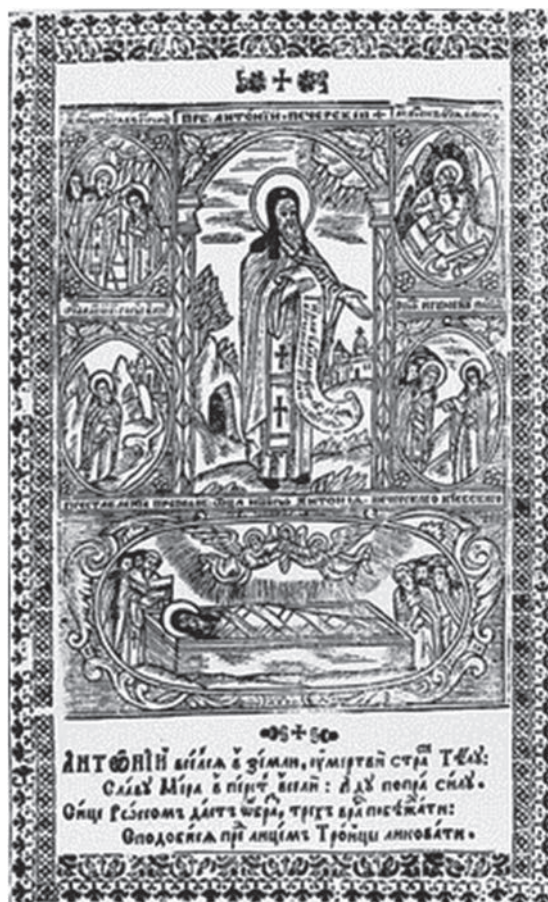
Прп. Антоній Печерський. Гравюра. Києво-Печерський патерик. К., 1661