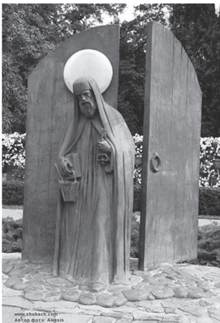
Бронзовий монумент святому преподобному Печерському чудодійнику, князю Святославу-Панкратію Давидовичу Чернігівському (Миколі Святоші) скульптора Є.І. Дерев'янка

Києво-Печерська лавра стала справжнім колектором у передачі знань античного світу та монастирської медицини. За часів Київської Русі лікувальна справа в Києво-Печерській обителі спочатку розвивалася келійно — окремо практикуючими ченцями, як-то преподобними Агапітом, Даміаном, Алімпієм, Григорієм-чудотворцем та ін.