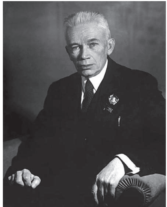
Богомолець Олександр Олександрович, президент УАН із 1930 р., а в 1936-1946 роках — АН УРСР, академік АН УРСР, професор

досліджень у країні. Зазначимо, що наукова корпорація вчених-медиків у загальному вітчизняному науковому поступі відіграла важливу роль і серед дев'яти очільників НАН України двоє були фаховими лікарями.