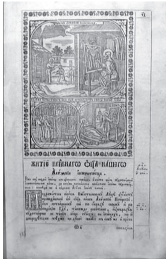
Опис у «Печерському Патерику» життя Алімпія-іконописця