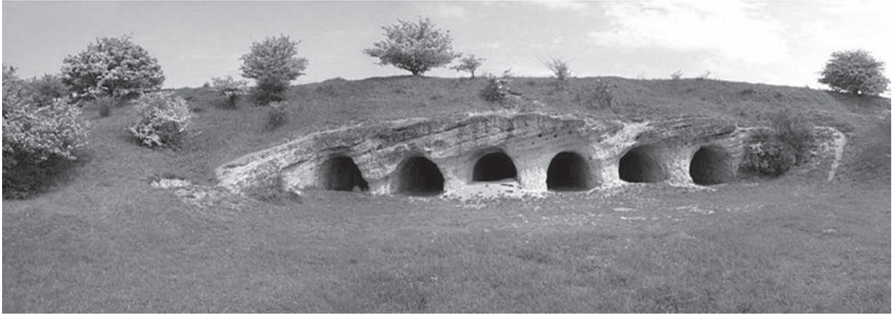
Вигляд на один із десяти скельних храмів Стільського городища VIII-X століття, що поблизу містечка Миколаєва на Дністрі у Львівській області