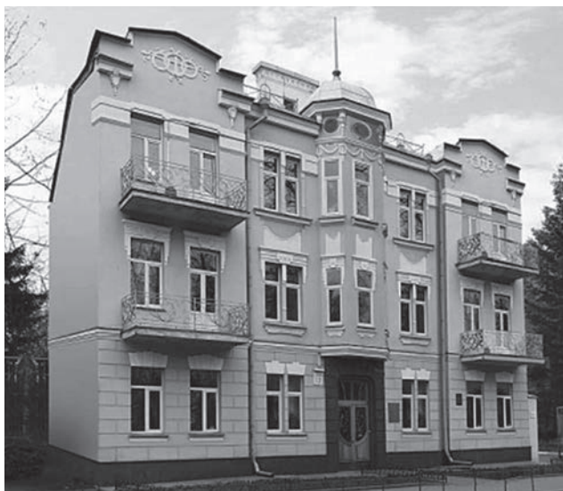
Будівля Національної академії медичних наук України, м. Київ, вул. Герцена, 12