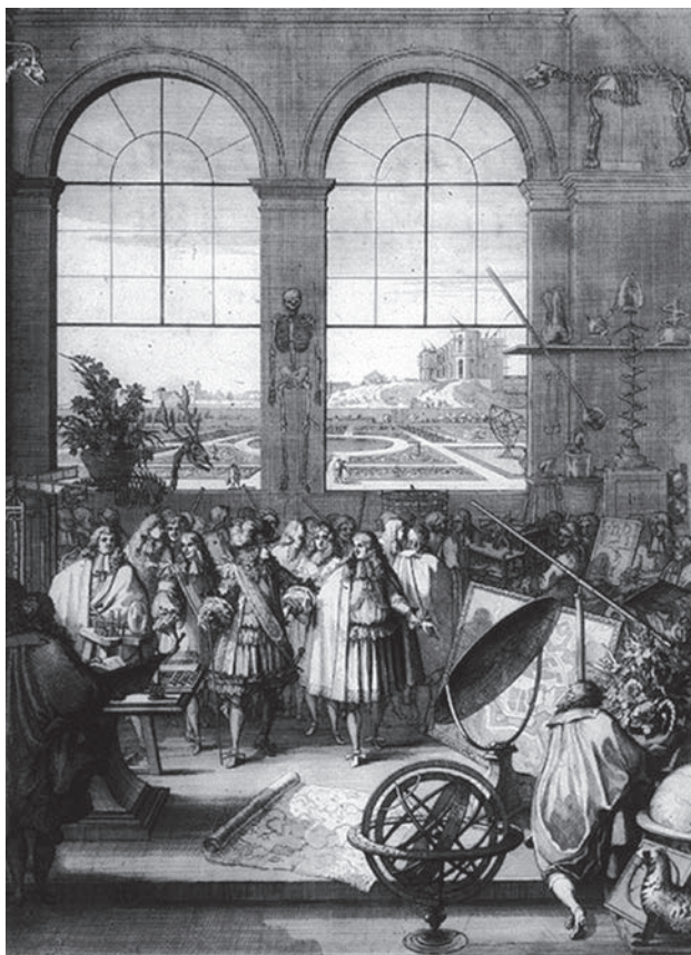
Король Франції Людовик XIV відвідує Академію наук

Утім, академія наук як форма структурної організації наукової корпорації має досвід вже багатьох сторіч. Однією з перших в Європі академії наук є французька (Académie des sciences). За пропозицією знаменитого Жана-Батиста Кольбера вона була заснована в 1666 році королем Франції Людовиком XIV безпосередньо для заохочення й захисту духу французьких наукових досліджень. Зазначимо, що історична ретроспектива давно