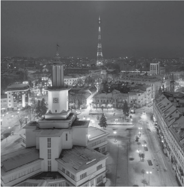
Чарівний краєвид вечірнього Франківська https://www.facebook.com/IFrankivsk/photos/a.1010396139030998/2486588651411732/?type=3&theater