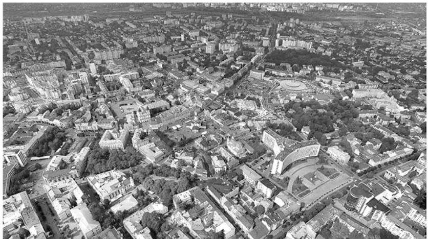
Івано-Франківськ із висоти пташиного лету

Майже навпроти центрального входу до Івано-Франківського міського кладовища, у 27-му