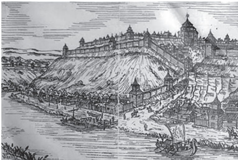
Резиденція князя Самослава — Стільсько