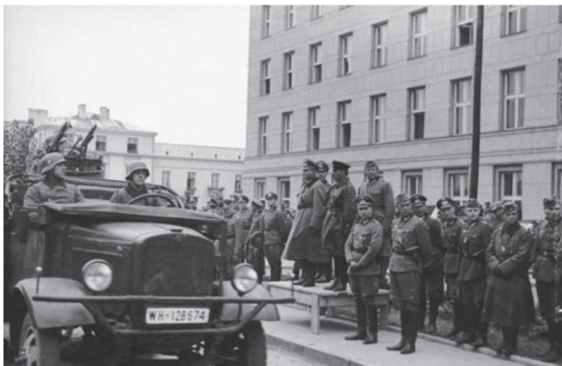
Брестя 22 вересня 1939 р. На трибуні — німецький генерал Гайнц Гудеріан і радянський комбриг Семен Кривошеїн [ https://uk.wikipedia.org/wiki/Спільний_парад_Вермахту_та_РСЧА_в_Бресті ]

і не збирався виконувати. Та й загалом цей договір більш відомий як сумновідомий Пакт Молотова — Ріббентропа. Реальна суть його була саме в таємному додатковому протоколі, що визначав сфери взаємних інтересів обох держав у Східній Європі й, зокрема, і щодо поділу Польщі між двома союзниками на початку Другої світової війни. Тож Прикарпаття було окуповане радянськими військами 17 вересня 1939 року. Союзники на відзначення своєї перемоги та знищення Польської держави 22 вересня 1939 року в Бресті та інших захоплених містах навіть провели спільні паради німецьких і радянських військ. Також на початку Другої світової війни сталінський режим згідно з таємним протоколом Пакту Молотова — Ріббентропа, окрім Польщі, також анексує території і сусідніх європейських держав Румунії, Фінляндії та країн Балтії. Однак після завершення союзниками окупації європейських держав вони вже зупинитись були не здатними. 22 червня 1941 р. обидва загарбники сходяться в смертельному герці. Розпочалась війна між гітлерівською Німеччиною та Радянським Союзом. Усі ці події на багатостраждальне Прикарпаття приносять чергову біду — вона перемінно опиняється то під радянською, то під німецькою окупацією. Родина Бережницьких протягом усієї війни постійно перебувала в Калуші. Мирослав Миколайович та його брати й сестри продовжували навчання в школі за радянської (1939-1941 рр.) та подальшої німецької окупації (1941-1944 рр.). А після остаточного вигнання фашистів у 1944 році із При-