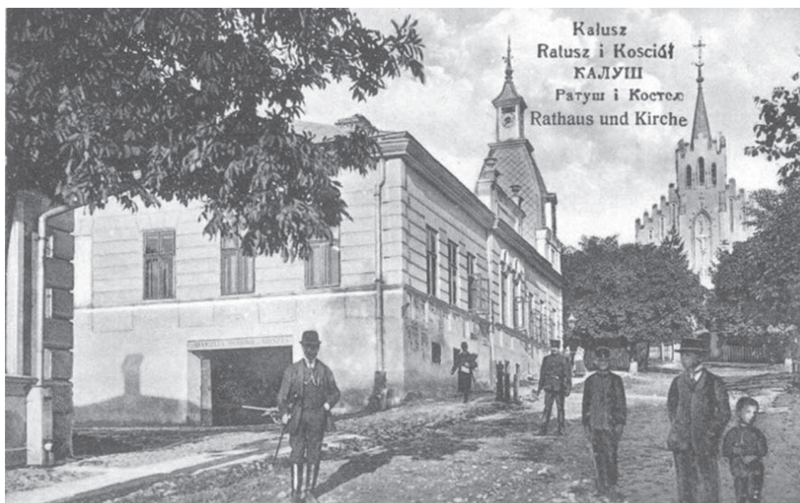
Ратуша і костел Калуша, початок ХХ століття