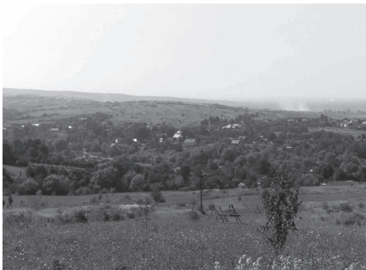
Бережниця. Типовий краєвид бойківського селища [ https://commons.wikimedia.org/w/index.php?curid=42817651 ]