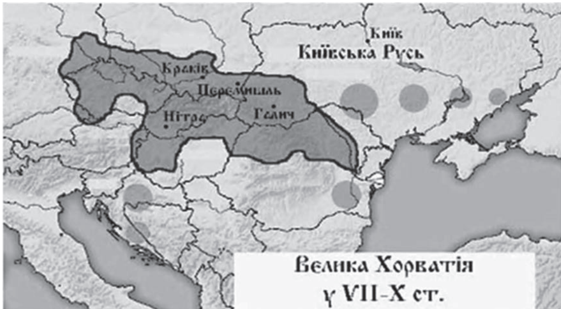
Терени держави карпатських хорватів