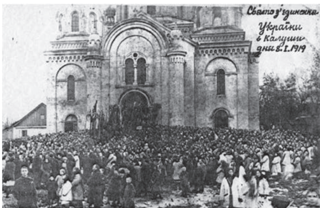
Свято з'єднання ЗУНР і УНР у Калуші 8 січня 1919 року [ https://commons.wikimedia.org/wiki/File:Свято_з'єднання_ЗУНР_і_УНР_у_Калуші_8_січня_1919_p.jpg ]

ності України в 1991 році. Уродженці Бойківщини завжди пам'ятали свою українську ідентичність і прагнули Соборної України. У такому історичному річищі протягом сторіч і становився бойківський люд на теренах Калуського краю [68].