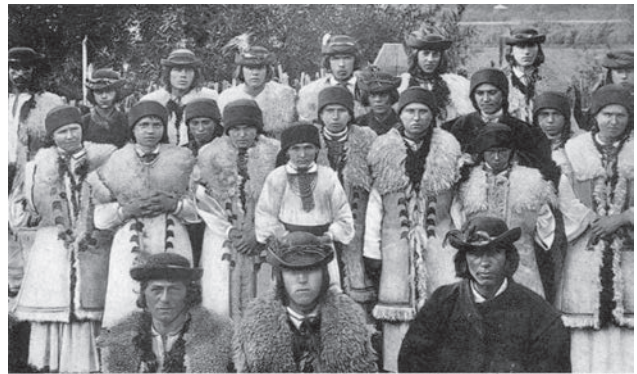
Калушський повіть. Крестьянські типи (бойки) із Ясеня.

Калуш є знаним містечком Бойківщини [2, 17, 18]. Бойківський субетнос [19-26] є автохтонним для північних і південних схилів Карпат від річок Лімниця й Тересва на сході до річок Уж і Сян на заході. Походження бойків є однією з найбільших загадок історії українства. Тим часом про Бойківщину маємо першу писемну згадку ще в 948-952 роках нашої ери в компілятивному творі візантійського імператора Костянтина VII Багрянородного «De Administrando Imperio» (Про управління імпері-