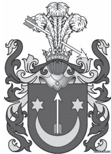
Герб Сас III

«друже» або «сябро». Їхня добре розвинута мова стала мовою не тільки літературною, а й діловою та офіційною в Русі та Литві. Їх внесок у багатьох державно-політичних формуваннях є важливим.