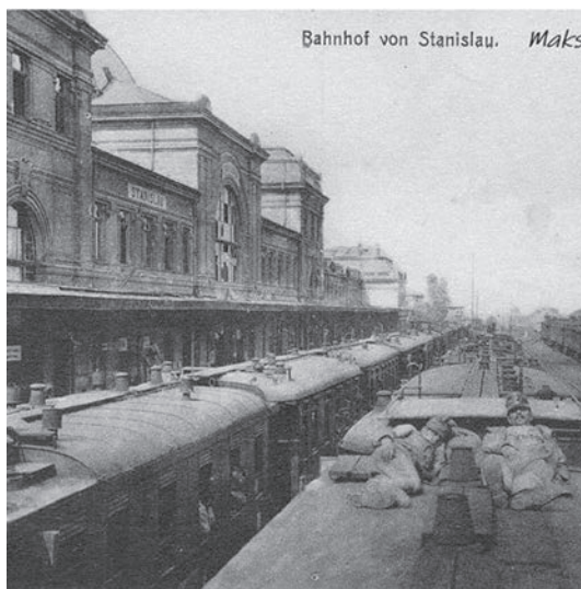
Колії вокзалу Станіслава. Уродженці Галичини військовики 1-ї світової вертаються додому