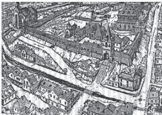
Малюнок М. Гаталевича «Калуський королівський замок»