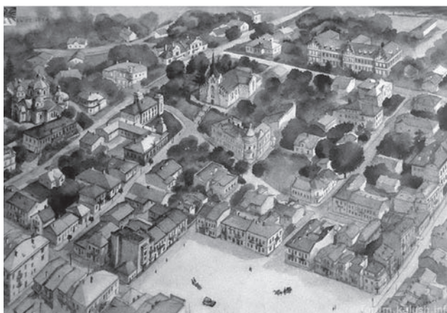
Середмістя з ринковою площею в Калуші, художник М. Гаталевич