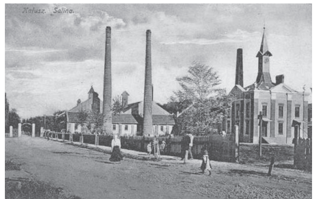
Ратуша калійного заводу, початок XX століття [ https://kalushnews.city/read/history/3182/starij-kalush-evropejske-misto-pyat-faktiv-ale-odin-z-nih-brehnya ]