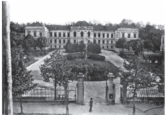
Головний корпус медичного факультету Львівського університету імені Франца І (1894 рік) [ https://uk.wikipedia.org/wiki/Львівський_національний_медичний_університет_імені_Данила_Галицького#/media/File:Медінститут.JPG ]

ськово-цивільна адміністрація здійснює активні заходи щодо відновлення зруйнованого господарства міста, підприємств і залізниці. Та для втримання ситуації радянській владі необхідно було мати належний контроль насамперед над обдарованою молоддю бойківського краю. Тож під ретельний контроль беруться освітні заклади. За цього ті, які мали глибоку національно-освітню традицію, жорстко переформатовуються, а теологічні «просто» ліквіднуються, їх викладачі були піддані репресіям. У березні 1946 року було ліквідовано Українську Греко-Католицьку Церкву. Саме в цей період, незважаючи на наявність у Львові найдавнішого в Україні (що діяв із 1784 року [77, 78]) вищого медичного навчального закладу, такі одночасно засновуються й у трьох сусідніх областях (у Станіславській та Чернівецькій — медичні інститути, а в Закарпатській — медичний факультет університету).