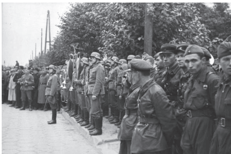
Фрагменти параду