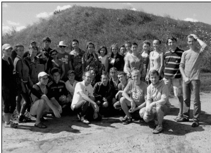
Рис. 4. Екскурсія валами Західного Більського городища

поховальних пам'яток Більського городища, зокрема, кургану на Перещепинському могильнику та селища Перше Поле. Велись масштабні археологічні розвідки на селищах Безодня, Царина, Сад, Лісовий Кут, Поле другої бригади, Перещепино. Цікавою була й екскурсійна програма (рис. 4).