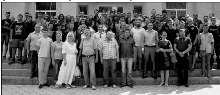
Рис. 1. Учасники Літньої археологічної школи в Більську

не майбутнє, у них закладаються підвалини наукових інтересів. Тому особливо важливо на згаданому етапі подати їм необхідний рівень знань, умінь і навичок, що заклали б теоретичну та практичну основу їх майбутньої роботи. Саме реалізації цих завдань спрямована така форма навчальної роботи як літня археологічна школа. Вона проходила в липні та серпні 2015 р. у с. Більськ Котелевського району Полтавської області, на відомому Більському городищі скіфської епохи. Була покликана виконати саме ці цілі (рис. 1). Організаторами цього заходу стали Інститут археології НАН України й Історико-культурний заповідник «Більськ», за сприяння місцевих органів влади та громадськості.