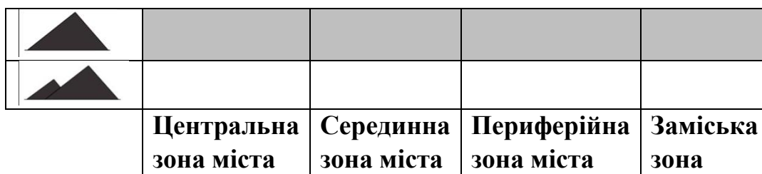
Особливості розміщення териконів та їх груп у структурі міст Донбасу

Висновки. Отже, аналіз сучасної планувальної структури містобудівних утворень Донбасу дозволив виявити особливості формування відкритих міських просторів й порушеному середовищі. Перш за все слід зазначити, що розташування порушених територій нерозривно пов'язане з історичним розвитком населених пунктів на території даного регіону, природними умовами та закономірностями формування вугледобувної промисловості. Проте кожна з зон міста, як виявило дослідження, теж має свої особливості формування відкритих міських просторів.