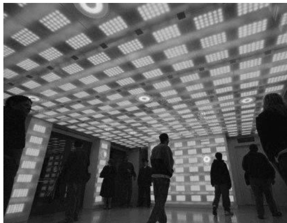
Рис. 6. Підсвітка інтер'єру. [10]

Приклад оформлення дизайну інтер'єру ресторану з використанням освітлення.