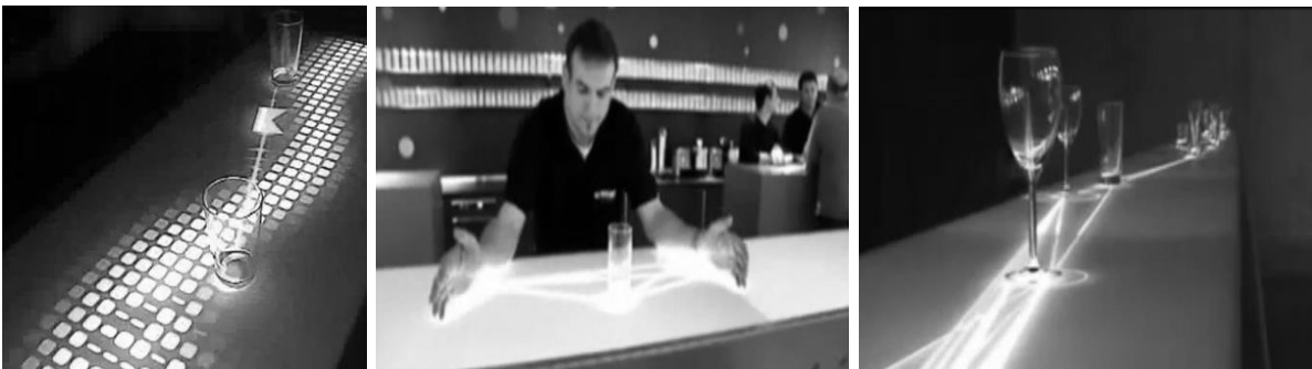
Рис. 1,2,3. Барна стійка з сенсорним покриттям. [12]

Тобто коли хтось буде щось ставити чи просто торкатися столу, буде реагувати панель і відображати певні малюнки чи дію. (рис. 1,2,3).