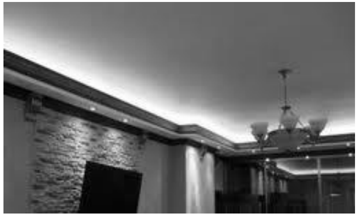
Рис. 5. Підсвітка стелі. [10]