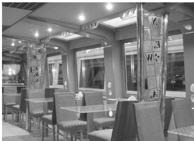
Рис. 8. Кафе у стилі хай-тек [12]