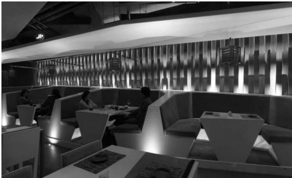
Рис. 9. Кафе в сучасному стилі [13]

Стиль хай-тек на кухні, ресторани чи кафе – сучасність, стиль, функціональність і поза сумнівом, краса. На відміну від інших стилів, в його рамки досить гармонійно вписуються всілякі технологічні пристрої, без яких складно собі уявити сучасну кухню: мікрохвильовка, посудомийна машина, новомодна витяжка, жалюзі з автоматичним механізмом, безліч кухонних приладів і комбайнів. Кухні в стилі хай-тек відрізняються сучасним стилем, яскравими деталями, сміливими і виразними контурами, користуються популярністю, як у любителів всього нового і сучасного, так і у шанувальників класичного стилю. Для посилення враження використовуються контрастні кольори. Величезна увага приділяється освітленню-як приховане, так і спрямовані джерела світла. (рис. 9).