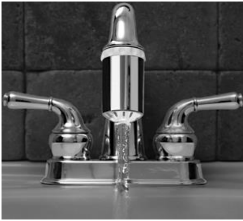
Рис. 4. Підсвітка води. [10]