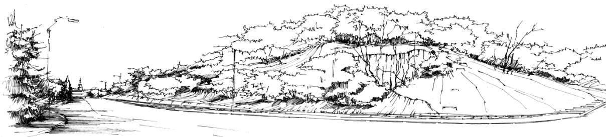
Рис. 3 Рельеф Журавлевских склонов по ул.Шевченко.

пусть и очень короткий, остается в памяти. Эмоций добавляет и колорит. Кирпичная стена в тени имеет темно-красный цвет. Красная полость, поглотившая путника, сродни багровой тьме Низа мира, описанной в мифах Греции. Через такую же «пещеру» может пройти современный человек, совершая путешествие по улице Дарвина. И, что интересно, проход через современную «пещеру» так же ведет в нечто иное. После тьмы прохода-лабиринта зритель вдруг видит огромный мир: огромное небо и город, лежащий далеко внизу. Камерная узость и интерьерная закрытость городской улицы сталкивается здесь с открытостью естественного ландшафта – высоко поднятой над долиной реки рельефной бровкой Журавлевских склонов, дикой травой и деревьями. Земля перестает быть по-городскому ровной. Интерьер города распаивается вовне. Это пограничный мир между культурой города и природой внешнего мира. Вверху – небо с облаками, внизу – река в плотной городской обстройке, а далеко на горизонте, в мареве, пологие салтовские холмы.