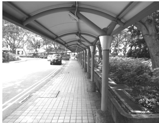
Рис. 8. Критий тротуар

відвідувача до певного настрою та розуміння архітектурної будови, ансамблю. Для такого простору характерні: велика кількість малих архітектурних форм, обмеження простору вертикальними перешкодами, формування ліній зелених насаджень або включень існуючого ландшафту, можливе влаштування «зимових садів», розмах простору по вертикалі та