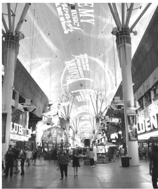
Рис. 13. вул. Фрімонт в Лас-Вегасі

Перекрыття простору кварталу викликає відчуття цілісності комплексу, єдиної стильової ідеї, захищеності, відчуття внутрішнього дворового простору, з чергуванням відкритих та закритих просторів, схожості з простором стадіону. Відчувається багато повітря, панорамність, стилізація неба-купола.