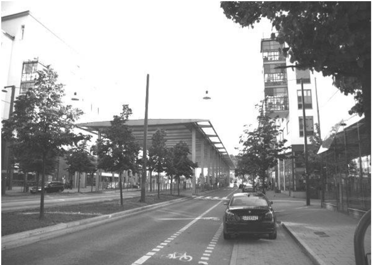
Рис. 4 (а). Трамвайна зупинка у Стокгольмі.

Зупинки громадського транспорту. Простір зупинки пов'язаний із такою поведінкою людини як очікування (транспорту) та характеризується різнонаправленістю руху людей. Локальне перекриття зупинки пов'язане з укриттям від несприятливих погодних умов, вітру та шуму. Здебільшого, у вітчизняній практиці цей навіс невеликий за площею і тому психологічно простір під ним не сприймається як окреме середовище. Проте, на прикладі зупинки у Стокгольмі (рис. 4 а,б,в) видно, що масштабне перекриття дозволяє не лише забезпечити необхідні умови укриття, але також забезпечити акцент на прямій лінії трамвайного руху. Цей простір відчувається як відокремлений та самодостатній, представляє собою величезний навіс із скляним дахом, місцями без даху взагалі. Відчуття простору та динаміка руху залишається, вони підкреслені чіткою геометрією.