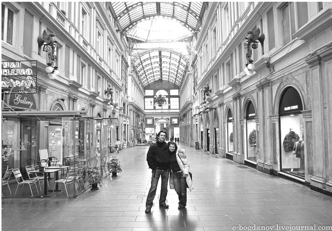
Рис.5. Крита вулиця в м. Брюссель

об'єктами, направленість руху виражена найбільше. Відчуття захищеності від дощу та снігу досягається завдяки суцільній покрівлі. Недоліки: влаштування навісу або карнизу на невеликій висоті, обмежена можливість виносу у ширину без влаштування додаткових опор – все це ніби створює відчуття тиску та обмеженості по розвитку руху ввєрх. Відсутність додаткових опор має особливе значення – без них навіс сприймається як частина споруди (рис.7-8).