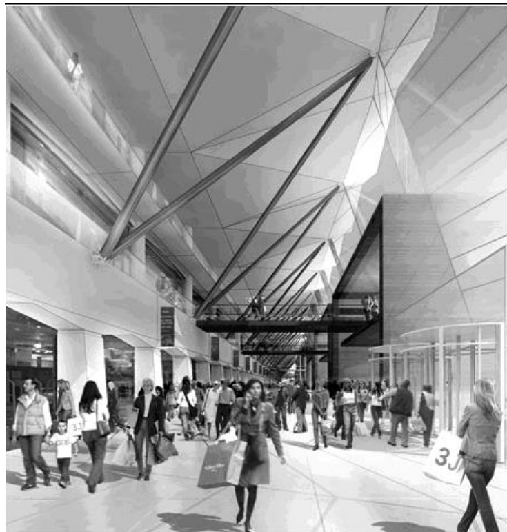
Рис. 3. Крита пішохідна зона громадського транспорту.