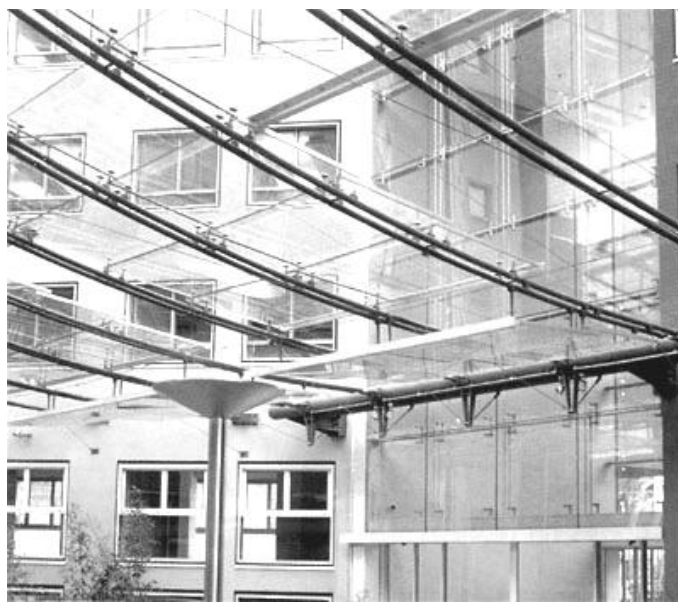
Рис. 14. Внутрішнє подвір'я Міланського адміністративного комплексу

Висновки. Кожний з розглянутих архітектурних просторів має свій вплив на сприйняття людини, в залежності від висоти розташування та розмірів перекрыття, використаних матеріалів, наявності та типу просторових обмежень. У будь-якому випадку, наявність покрівлі справляє позитивне враження, почуття захищеності та комфорту. У деяких випадках її використання не тільки бажане, але і необхідне.