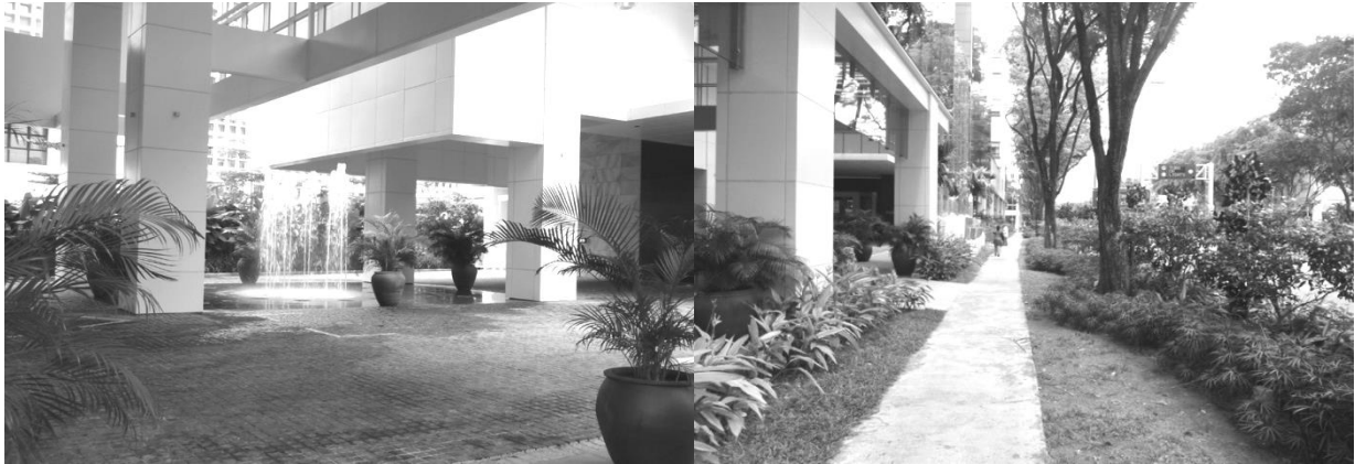
Рис. 9, 10. Стокгольм. Новий житловий район Sickla.

горизонталі, винесення вертикальних зв'язків з оточуючими будівлями та спорудами, використання центральної домінанти (рис.11,12).