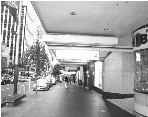
Рис. 7. Вулиця з навісом