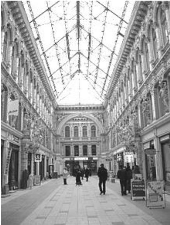
Рис. 1. Пасаж

найбільш поширеними є зупинки громадського транспорту, пасажі та деякі простори громадських будівель.