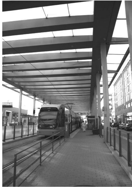
Рис. 2. Зупинка громадського транспорту