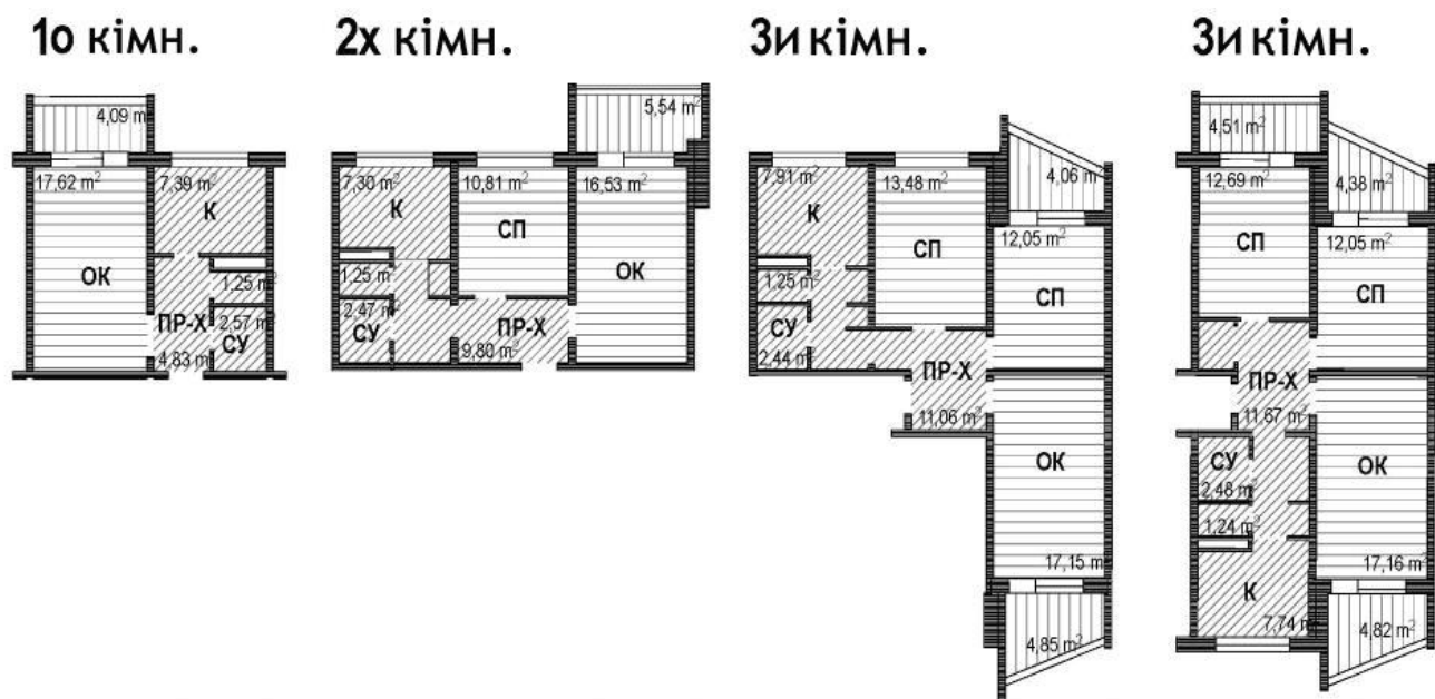
Рис.1. Типи квартир 70-80-х років [4]

Одним з економічно-вигідних методів було обрано панельне будівництво, тому що собівартість таких будинків на 30-40% нижче ніж цегляних, а строки зведення в 2,5-3 рази швидші. Такі будинки зводилися швидкими темпами, з найменшими затратами. В той же час мало уваги приділяли комфортності та умовам проживання. Технологія будівництва панельних будинків не забезпечувала енергозберігання, гідро та шумоізоляції, а також мінімально враховувала умови комфортності проживання у таких будинках (рис.1).