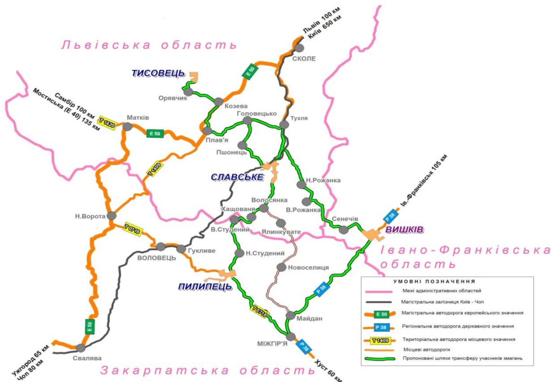
Рис. 3. Транспортні зв'язки ареалу олімпійського центру.

Пропонований ареал населених пунктів забезпечений розвинутою транспортною мережею (мал. 3).