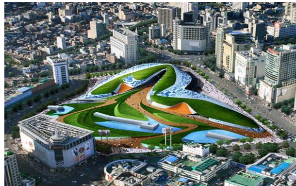
Рис.6. «Дондемун дизайн-парк плаза»

Намагаючись перетворити Сеул на міжнародний центр дизайну, туди запрошуються найкращі творчі сили цієї сфери діяльності, і саме для того, щоб створити в цьому місті найсприятливіше середовище для дизайнерів Сеул будує Дизайн парк Дондемун [4]. Тут будуть проходити виставки, аукціони, грандіозні покази, світові і цифрові шоу. Всі ці заходи для того, щоб підняти корейський дизайн на якісно новий рівень.