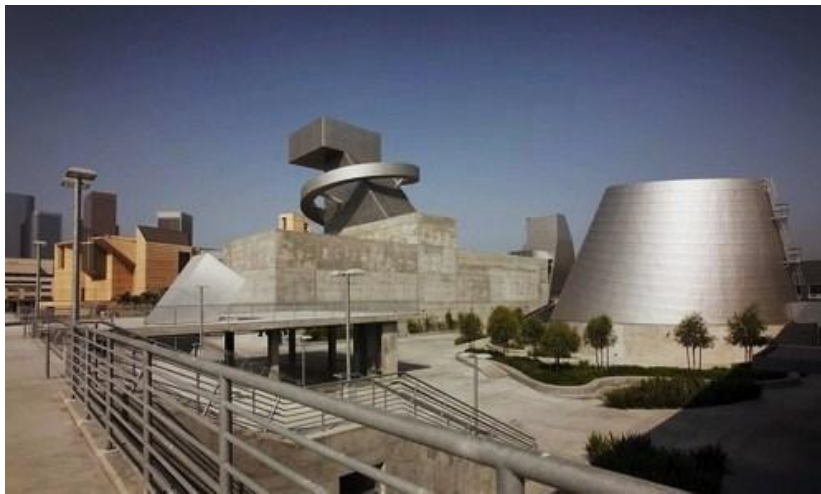
Рис.7. Вища школа зображувального і виконавського мистецтва в Лос-Анджелесі

Споруди виглядають гігантськими скульптурами, кожна із яких є частиною загальної експозиції. Абстрактні за формою і змістом, вони є домінуючими у об'ємно-просторовій композиції території школи [5]. Іноді поряд з ними з'являються острівці зелених насаджень – дерев та газону. У вирішенні саме ландшафтної організації школи дизайнери притримувались мінімалістичного підходу. Матеріали оздоблення фасадів, дорожнього покриття – демонструють досягнення прогресу у створенні штучних матеріалів.