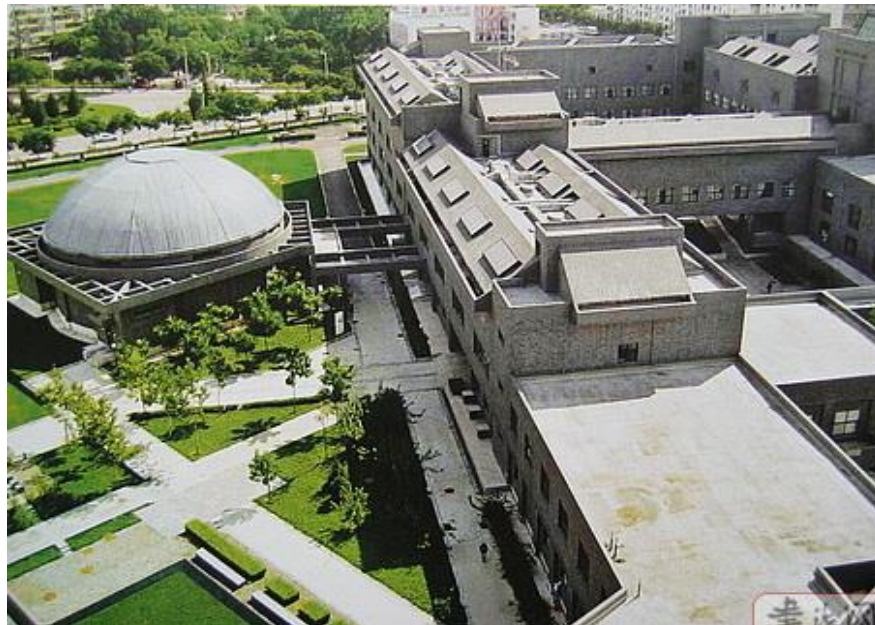
Рис.2. Територія академії.

В стилістиці як архітектурних об'єктів, так і об'єктів ландшафту відчуваються наслідування давнім традиціям китайської культури, але вони не цитуються, а є асоціативними (рис.2).