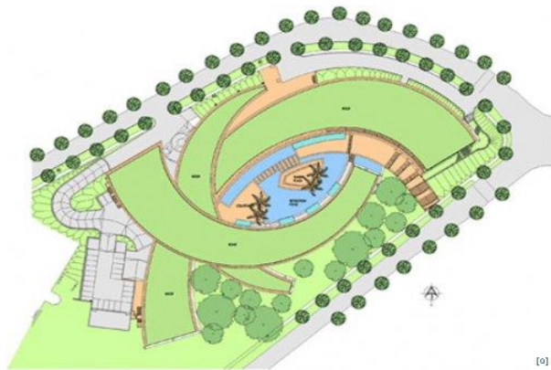
Рис.4. План школи в Сінгапурі

Планувальна структура території школи композиційно підпорядкована самій споруді, але вона не підкоряє простір, а являючись безумовною домінантою загального ансамблю, в той же час поступово «розчиняється» у оточенні (рис.4). В атріумному просторі панує водна стихія, що розділена на сектори доріжками і майданчиками. В архітектурно-планувальному вирішенні об'єкту були використані всі ландшафтні компоненти: рельєф (в його якості виступає зелений дах школи), вода (водойма з фонтанчиками у атріумі) і зелені насадження (з перевагою газонного покриття). Застосовані у різному співвідношенні, вони утворюють гармонійне ціле і забезпечують композиційну єдність ансамблю.