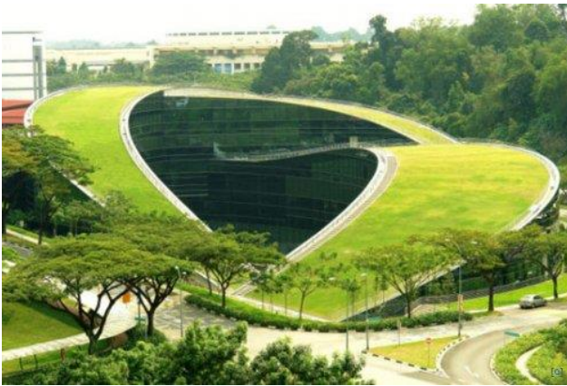
Рис.3. Школа мистецтв і дизайну

В органічній формі споруди, високій технологічності інженерних рішень були реалізовані головні засади екологічної архітектури [2]. Скляний фасад вбирає сонячне і теплове навантаження споруди, одночасно забезпечуючи природне денне освітлення для творчих приміщень. До того ж завдяки скляним стінам відбувається візуальне перетікання у внутрішній простір споруди природного оточення – ландшафту комплексу. Межі зеленого даху і зеленого оточення знівельовані.