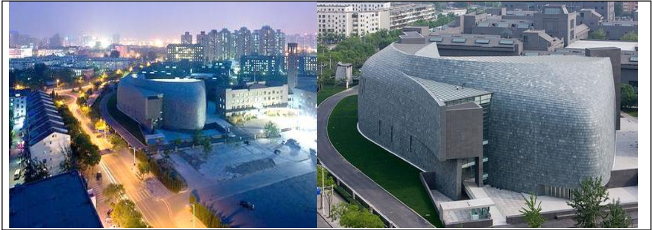
Рис.1. Музей мистецтв Центральної академії мистецтв (Пекін), архітектор Арата Ісодзакі

просторова домінанта архітектурного об'єму корпусів навчального закладу. Мінімалізм у вирішенні об'єктів ландшафтного дизайну, підтримується ортогональною системою функціонально-планувальної структури території. Перевага відкритих просторів уявно збільшує розміри території.