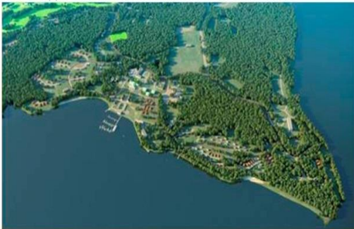
База відпочинку «SAIMA GARDENS»