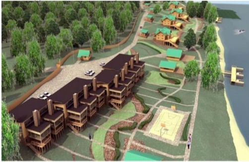
База відпочинку «Галух» на озері Селігер