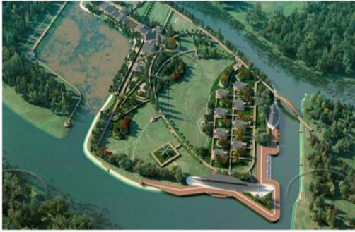
База відпочинку на річці Волга