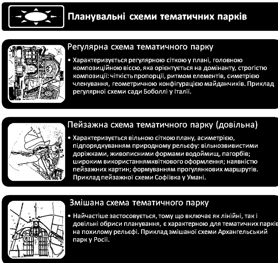
Рис.3. Планувальні схеми тематичних парків

Відповідно до планувальної схеми тематичні парки поділяються на регулярний, пейзажний, змішаний (рис 3.).