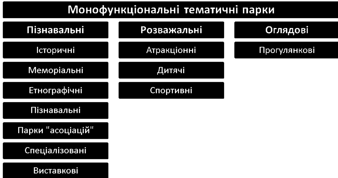
Рис.2.8.Класифікація монофункціональних тематичних парків.

дитячою, видовишно-масовою, культурно-просвітньою зоною, а також зонами прогулянок та тихого відпочинку. Взаємне розташування перелічених зон, як і їх сусідство із транспортними магістралями та прилеглими житловими кварталами, визначаються розумінням зручності користування парковими територіями різним контингентом відвідувачів.