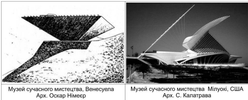
Рис. 3 Авторський почерк у архітектурі центрів мистецтв.

Архітектори прагнуть надати своїм об'єктам виразність на основі розуміння центру мистецтв як витвору мистецтва архітектури. Знаковость художнього образу дозволяє перетворити архітектурний об'єкт на символ міста.