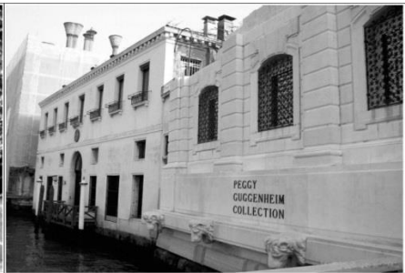
Музей Гуггенхайма колекція Пеггі Гугенхайм Венеція, Італія