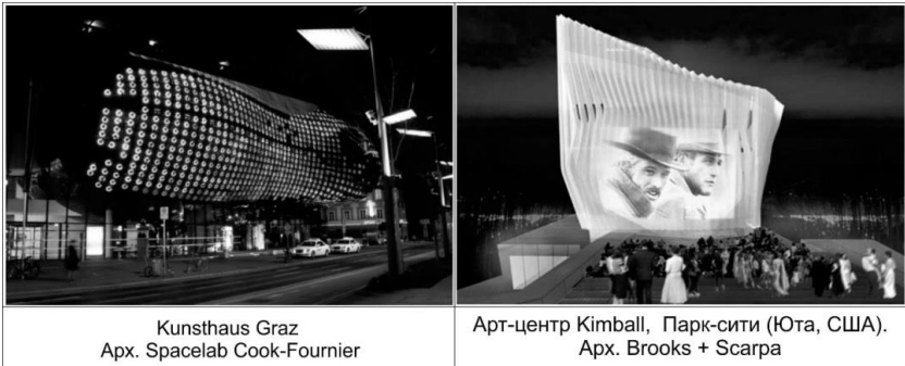
Рис.6 Використання медіа-технологій в архітектурі центрів мистецтв.

архітектура об'єкту, його геометрична форма і структура організації стають носіями і трансляторами інформації про метаморфози, що відбуваються, що може мати особливу актуальність при роботі з історичним середовищем. Нове бачення архітектури має синергетичний характер і відбувається на фоні всепроникаючого зростання інформаційної культури [1].