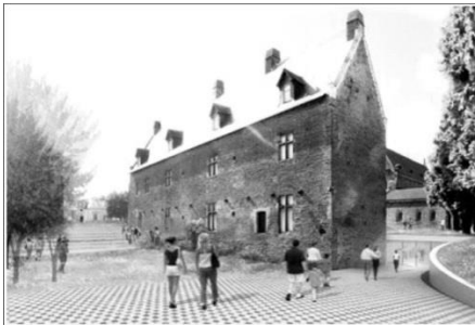
Реконструкція музею Добре, Нант, Франція Арх. Dominique Perrault