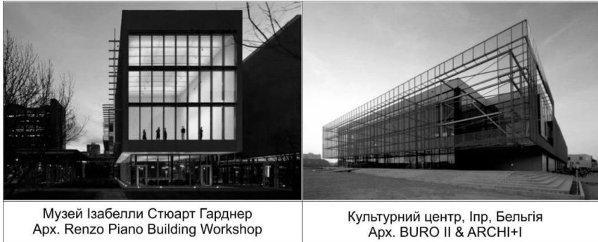
Рис. 2 Приклади «прозорої» архітектури центрів мистецтв.

багатошарово і була покликана втілювати творчий дух сучасного мистецтва і прогресу у Венесуелі [3].