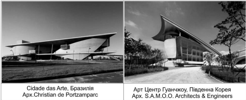
Рис. 4 Символізм у архітектурі центрів мистецтв.

Ідея синтетичності символізму виявляється в трактуванні будівлі як центрального елементу містобудівного, природного і соціально-культурного контекстів.