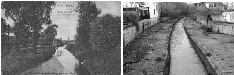
рис.1. Річка Либідь в кінці XIX ст. та сьогодні

р. Либідь у м. Київ стане першим кроком в напрямку озеленення та благоустрою міста. Це один з найяскравіших прикладів занедбаних рекреаційних просторів прибережних зон малих річок (рис.1.).