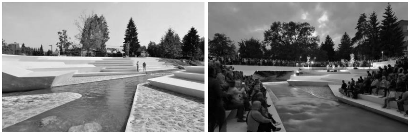
рис. 3. Реновація річки Пака у місті Велено (Словенія).

Зміна сприйняття городянами свого міста має приклади по всьому світові – перетворення занедбаних прибережних територій малої річки Пака у місті Велено (Словенія) на комфортне організоване місце для відпочинку населення (рис.3).